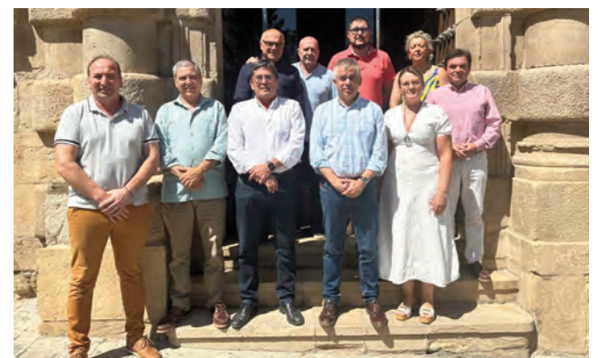
Asistentes a la reunión para la redacción del manifiesto conjunto.

En esta línea, subrayó la necesidad de que la Junta acometa las obras “cuanto antes mejor”. “No se ajusta a las necesidades y se ha sacado nuestro proyecto de la programación de las futuras infraestructuras, lo que supone hipotecar el futuro”, aseveró el alcalde marteño.