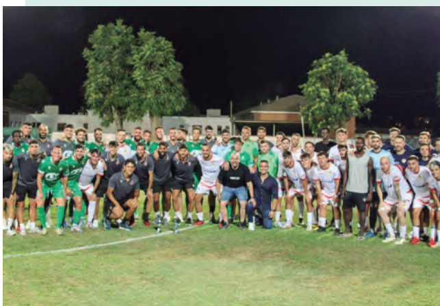
El Real Jaén se llevó el Trofeo Miguel Pérez Luque.