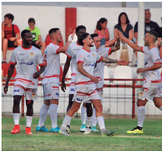
El Real Jaén ya se ha medido al Martos en la pretemporada.

REAL JAÉN El equipo de la capital jugará en Martos el 22-S. El primer desplazamiento, a Torredonjimeno