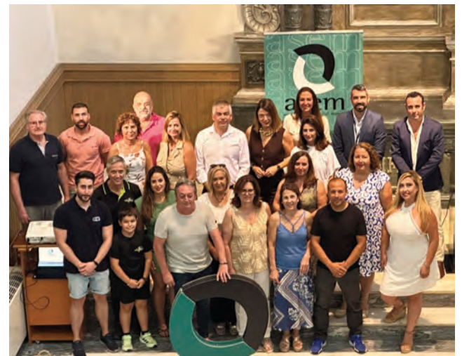
Empresarios marteños reconocidos con el Sello de Calidad en sus negocios.