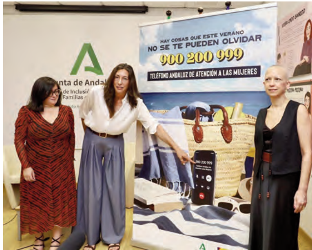
Acto de presentación de la campaña contra la Violencia de Género.

MUJER Este plan pone el foco en el teléfono 900 200 999: una línea gratuita, operativa las 24 horas del día y confidencial