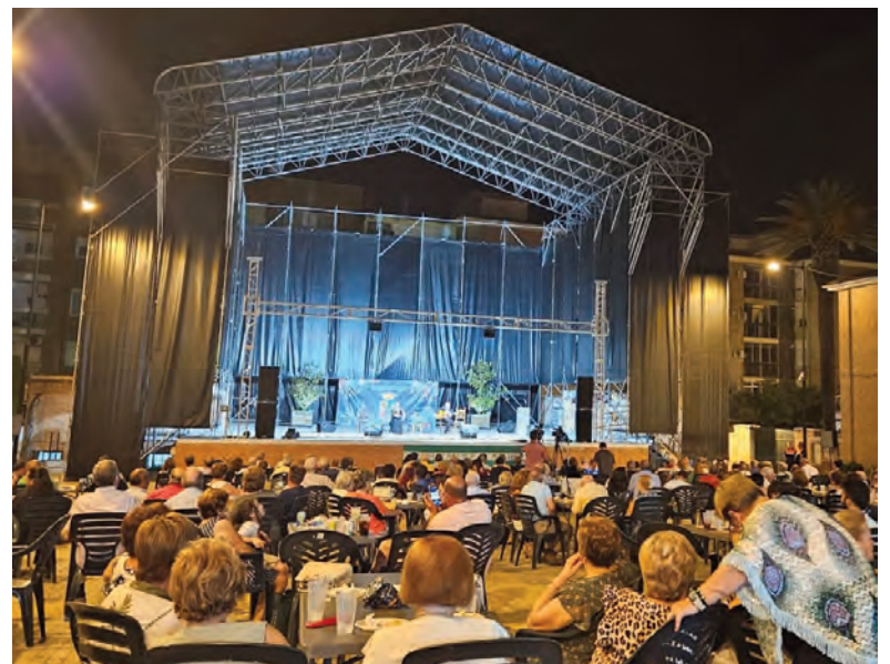
Cena de la Tercera Edad del 2023.