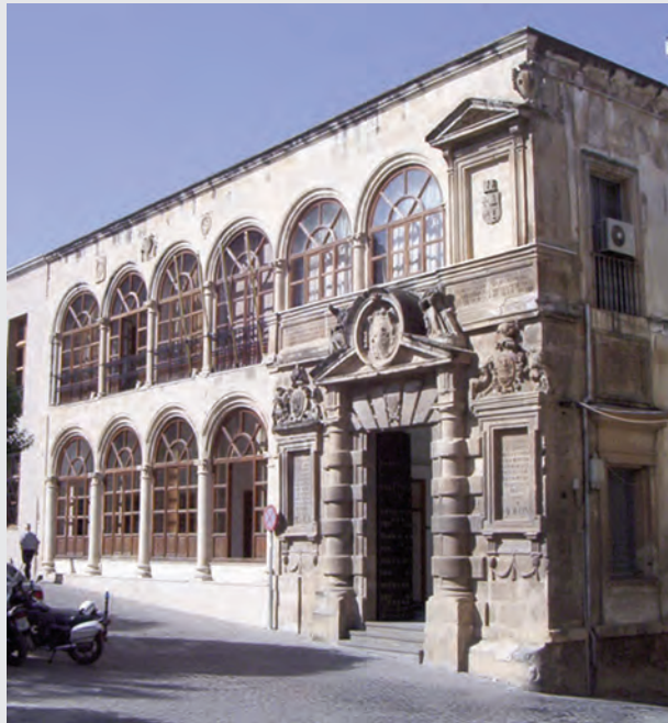
Fachada del edificio Consistorial de Martos.