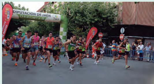
San Bartolomé volvió a congregarse un nutrido número de participantes para una carrera donde el calor no pudo con los corredores del CA Correcaminos de Martos.