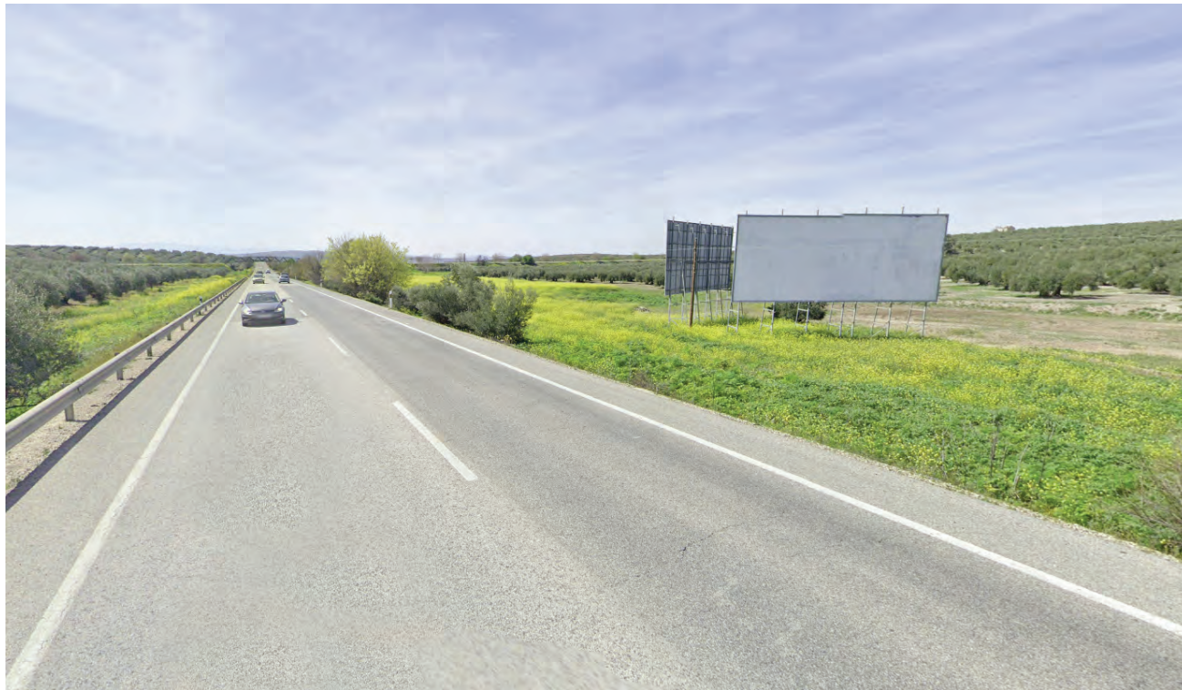
Suelo del futuro polígono olivarero ubicado en el margen de la A-316 en dirección al cruce de Alcaudete. VIVIR