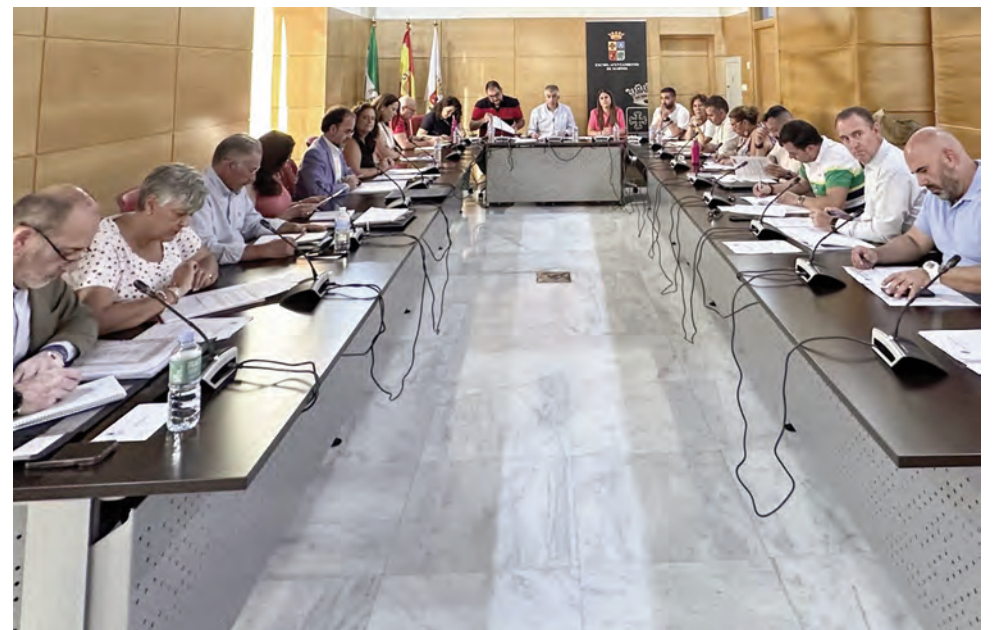
Sesión plenaria correspondiente al mes de julio de 2024.