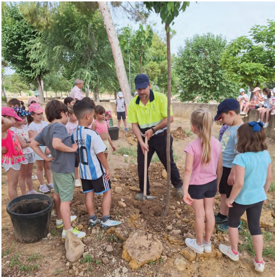
Parte del alumnado asistiendo a un operario en la plantación de árboles en San Isidro.

San Isidro era el lugar elegido para que, en un futuro, quienes han contribuido hoy a la generación de esas sombras y a la contribución al medioambiente, puedan disfrutarlo en esta emblemática celebración loperana.