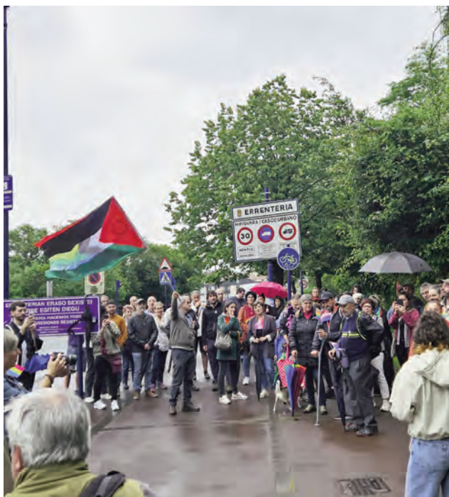
Homenaje a Francis en Rentería. F. SEVILLA.

La alcaldesa de Rentería recibió al concejal looperano en el ayuntamiento, así como la corporación municipal de Rentería saludando a los portavoces de Bildu, Podemos/Iu, Psoe, PP, PNV. Asimismo la alcaldesa de Rentería al finalizar la tarde agradeció a Sevilla su visita. "Gra-