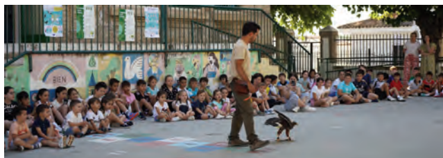
Alumnado asistente a la jornada de medioambiente. PROTECCIÓN CIVIL.

LOPERA | El CEIP Miguel de Cervantes y el IES Gamonares celebraba, con motivo del Día Mundial del Medioambiente, unas jornadas formativas con el objetivo de fomentar la conciencia medioambiental a los más jóvenes en los centros educativos de la localidad.