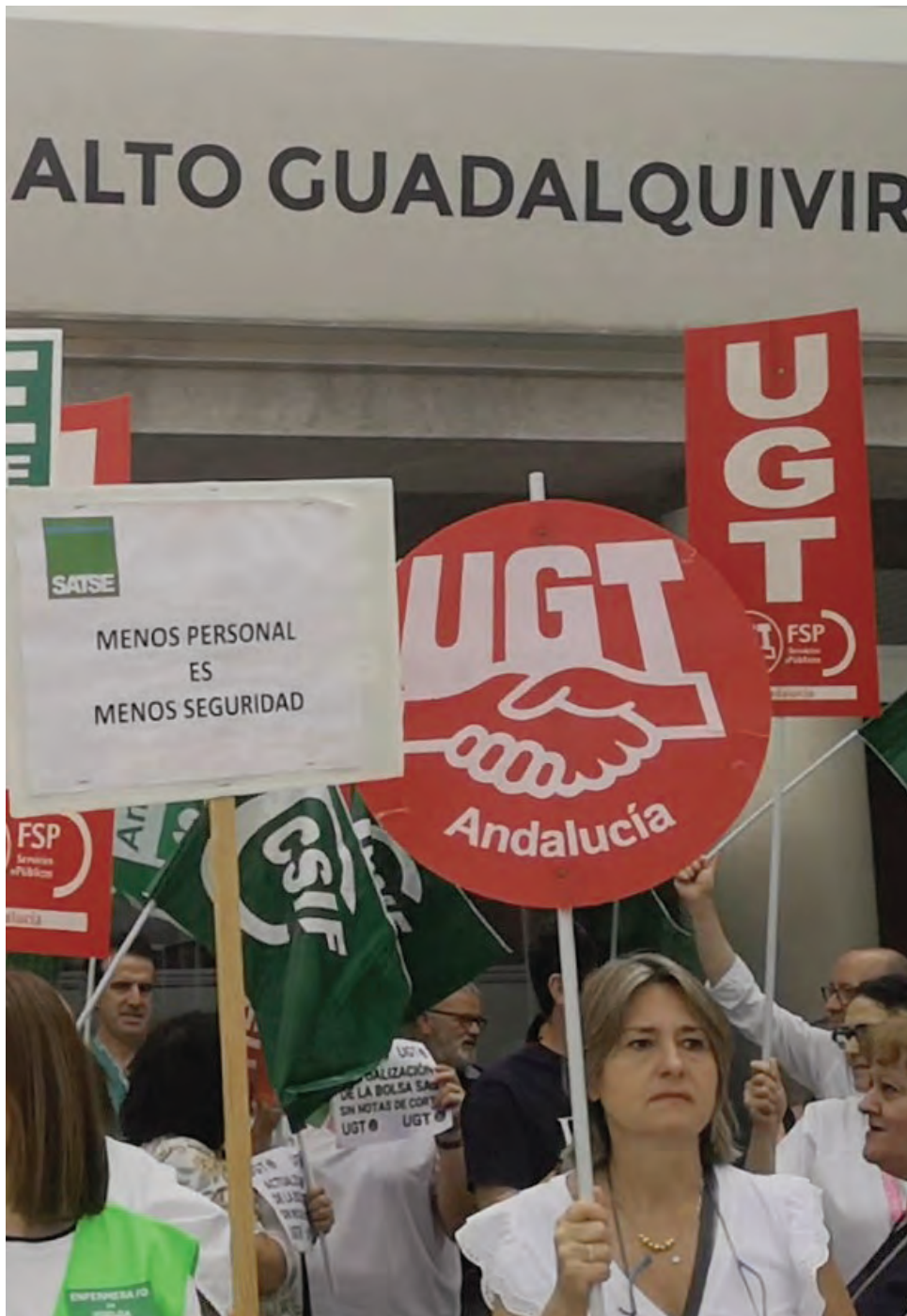
Manifestantes a las puertas del Hospital Alto Guadalquivir de Andújar.

El Hospital Alto Guadalquivir ha cubierto al 100% su plan vacacional y esta semana está acogiendo a los nuevos profesionales que van a reforzar su plantilla en verano.