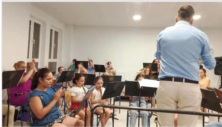
Agentes de la Policía Local en el taller celebrado en la Escuela Infantil Municipal.

LOPERA | La escuela de Música “Pedro Morales” de Lopera cerraba el curso académico con una audición de todos los estudiandos de su formación. Alumnos y alumnas de distintas especialidades musicales ofrecieron en las nuevas instalaciones de la