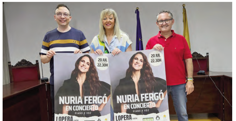
Alcaldesa y concejales en la presentación del concierto de Nuria Fergó.

rios. El concierto contará con la apertura de María Espinosa, la talentosa segunda clasificada en el aclamado concurso televisivo «La Voz» en su edición de 2019 en Antena 3. Con su cautivadora voz y su carisma inigualable, Espinosa cautivará a la audiencia desde el primer momento.