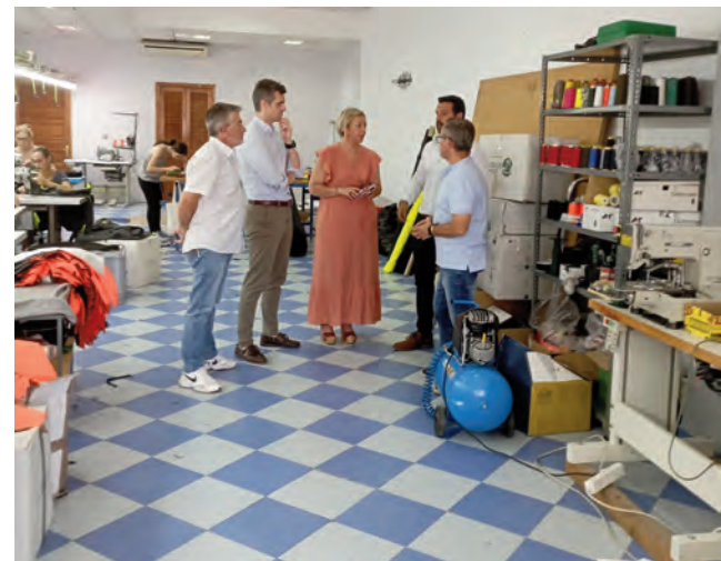
Diputado con empresario y representantes municipales.

Carmona también se reunía con la alcaldesa del municipio para tratar asuntos institucionales relacionados con el empleo en Lopera.