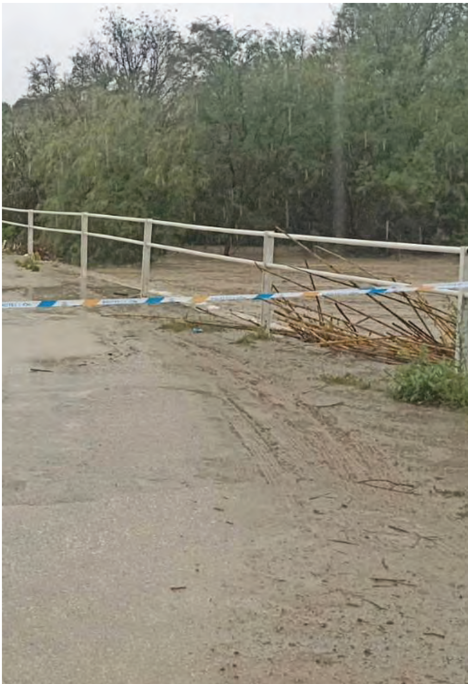
Vegetación acumulada en el Arroyo Salado de Lopera en época de lluvias.

En cuanto a las próximas actuaciones programadas por la CHG, se intervendrá en el río San Juan, a su paso por