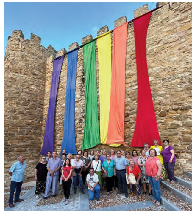
Lectura de manifiesto junto a la bandera arcoiris. AYUNTAMIENTO.