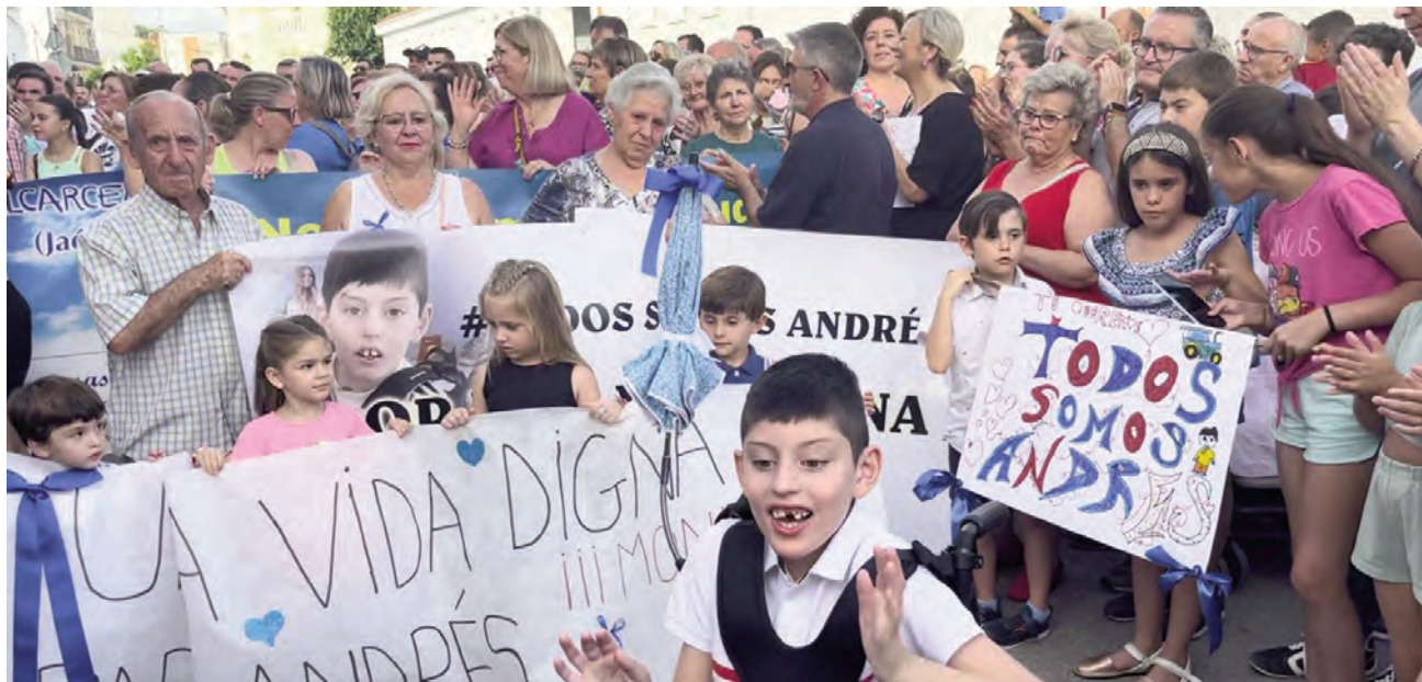
Manifestantes junto a Andrés en la reivindicación de un nuevo PTIS para atender al alumno del CEIP Miguel de Cervantes. VIVIR.

EQUIPAMIENTO La familia ha solicitado un adaptador, una grúa y una camilla adaptada para su aseo