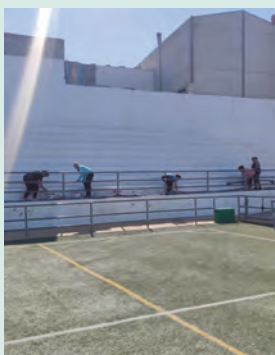
Campo de Fútbol de Jamilena.

Esta jornada marcó un fin de temporada por todo lo alto y supuso una pequeña celebración de la que viene. Asegurando el fútbol en Jamilena.