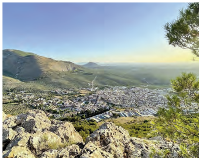
Vista panorámica de Jamilena.

CENSO Torredonjimeno, Torredelcampo, Linares, Andújar, Úbeda y Bailén son las grandes ciudades que contribuyen al descenso poblacional