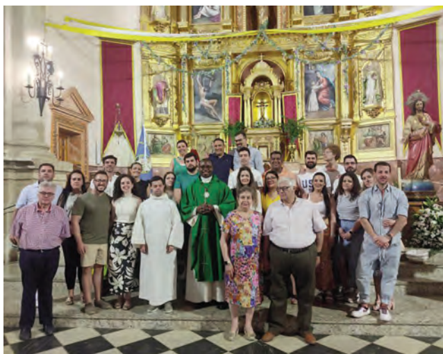
Foto de familia de las parejas participantes en los cursillos matrimoniales.

A lo largo del intenso fin de semana, se han acogido a los futuros esposos en el Centro Parroquial de San Bartolomé de Torredelcampo. Comenzó el viernes con la acogida y partiendo de la pregunta: ¿a qué os puede ayudar este cursillo? Se han ido desgranando diversos temas primordiales para la preparación al matrimonio: aspectos jurídicos y