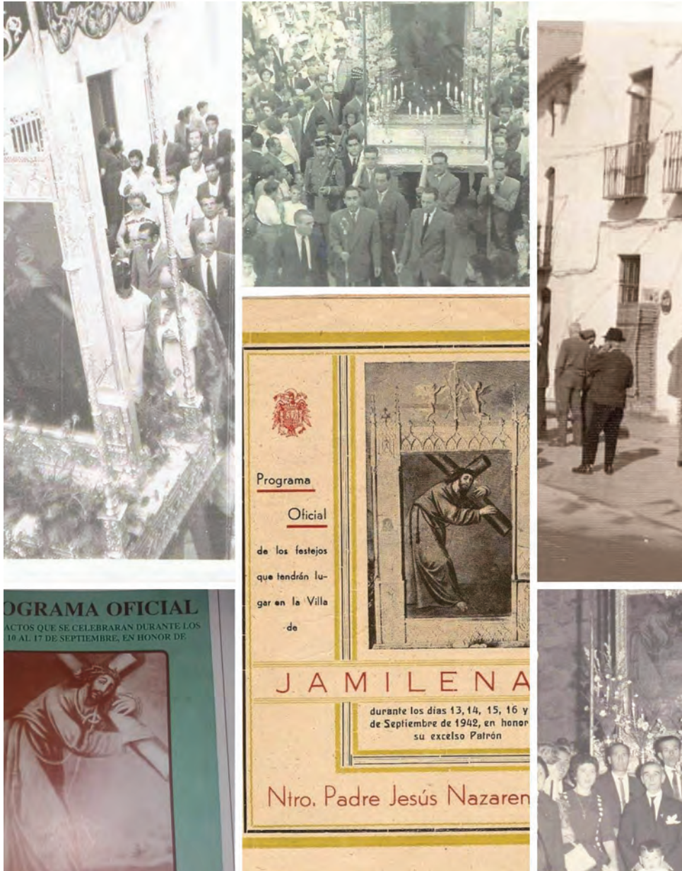
Collage de imágenes que celebra el Día de Jesús.

Desde el Consistorio han informado que esta documentación se puede dejar en el Ayuntamiento de cara a su digitalización. Asimismo, para evitar extravíos avisan de que los documentos deben ir en sobre cerrado que debe incluir el nombre del vecino/a y dirección, para su posterior devolución. También se puede enviar digitalizado al WhatsApp 636421388.