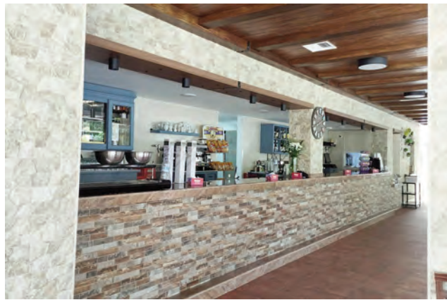
Estética del exterior e interior del bar-restaurante de la Piscina.

ACTUACIONES pavimento, instalación eléctrica, techo de escayola, vigas de madera, entre otros