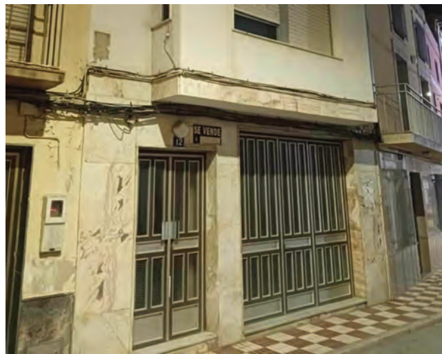
Casa Hermandad de la Cofradía de Nuestro Padre Jesús Nazareno.

SOLIDARIDAD El precio del azulejo es de 20 euros, aunque la Hermandad ha anunciado que se pueden realizar donaciones más elevadas