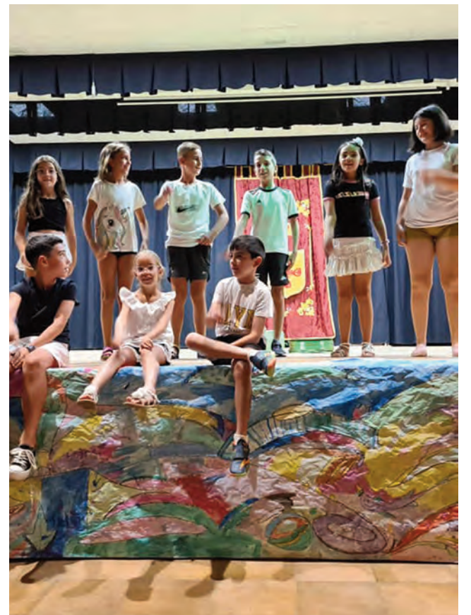
Clausura de la Escuela de Verano 2023.