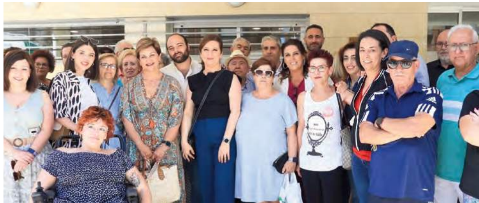
Visita al hospital de Alcaudete de representantes institucionales socialistas.

PÉRDIDA DE SERVICIOS Y DE PROFESIONALES _ El grupo parlamentario socialista visita el centro sanitario alcaudetense que quieren "convertirlo en un simple centro de salud"