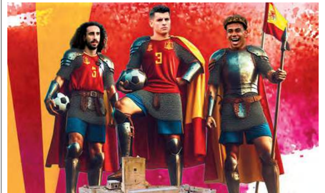
Imagen creada por el Ayuntamiento de Alcaudete.