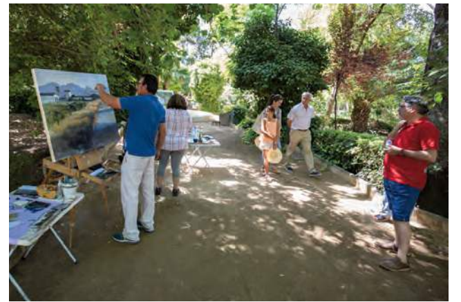
Imagen de la edición el año anterior del concurso.

Las propuestas se podrán presentar hasta el 3 de agosto a las 10:00 horas