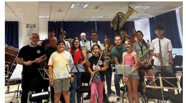
Imagen del grupo de componentes de la Charanga.

ALCAUDETE | Nacida a partir de un grupo de compañeros y amigos que componen la Banda Municipal de Música de Alcaudete, esta agrupación se estrenará el próximo 12 de julio, en el marco de las XIX Fiestas Calatravas de Alcaudete.