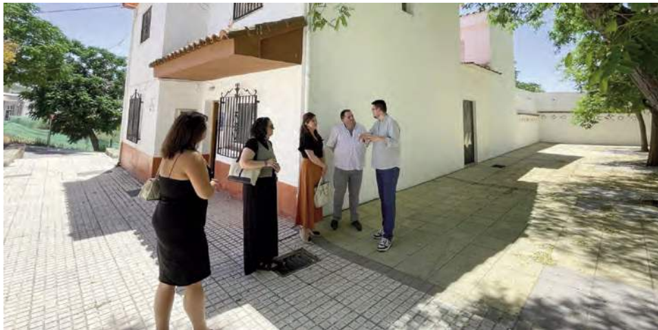
Visita a la instalación del albergue de peregrinos.