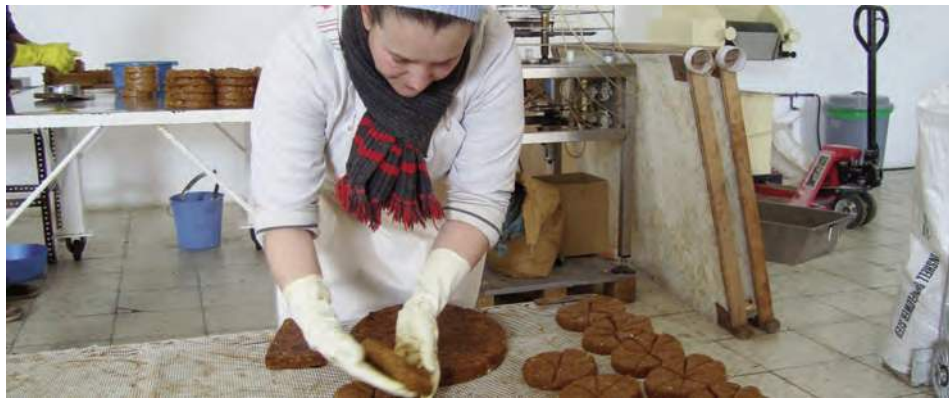
Trabajadora de Doña Jimena.

Debido a la alta demanda, las empresas se han visto obligadas a incrementar su