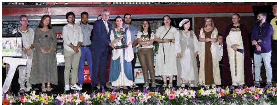
La alcaldesa de Alcaudete recibía el premio.

Son los argumentos con los que Diario Jaén otorgaba en base a la decisión de un jurado de expertos, un reconoci-