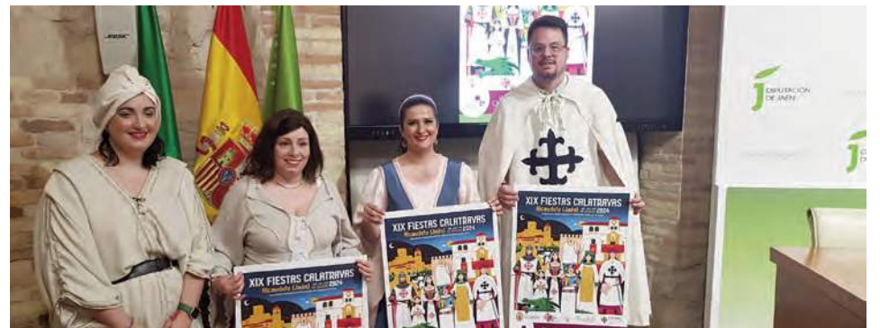
Presentación de las fiestas llevada a cabo en la capital jiennense. VIVA JAÉN

co de la Diputación, son “muchos los atractivos de este evento que cada año cuenta con más visitantes de otras localidades y provincias limítrofes, que se