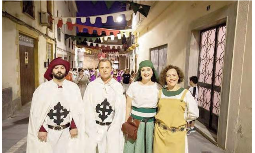
La edición de este 2024 pretende ser una de las más multitudinarias de las celebradas en los últimos años en base a una importante campaña de promoción que ha realizado el Ayuntamiento de Alcaudete. VIVA JAÉN

un deporte de contacto pleno donde los participantes utilizan armas y armaduras características de la Edad Media.