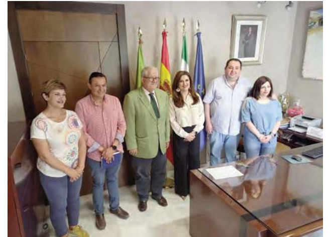
El delegado provincial, junto a autoridades locales.