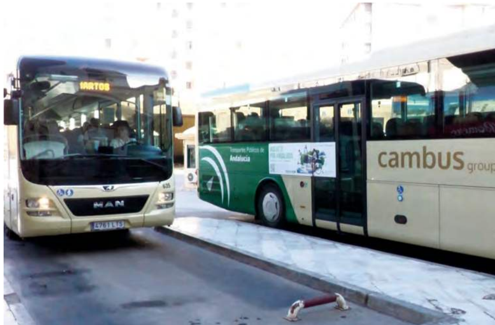
Los usuarios suspenden las soluciones tomadas en la 'crisis de los autobuses'. VIVA JAÉN

Una vez que conocimos la opinión del delegado de Fomento y los ayuntamientos de las localidades afectadas, era momento de conocer las sensaciones de los usuarios. Los principales perjudicados por la "crisis de los autobuses" en el Área Metropolitana Jienense dan un "suspense" a la situación generada por el concurso de acreedores de la empresa Cambus y a los servicios mínimos con los que la Junta de Andalucía ha intentado paliar los perjuicios a