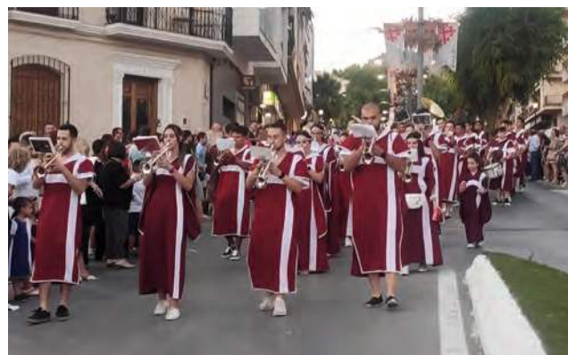
Agrupación Musical Nuestro Padre Jesús Cautivo en las Fiestas Calatravas '22.

Desde el Ayuntamiento expresaron su agradecimiento "por enriquecer nuestro legado" a la Agrupación Jesús Cautivo, que extendieron también al resto de bandas y agrupaciones que también participan en estas fiestas.