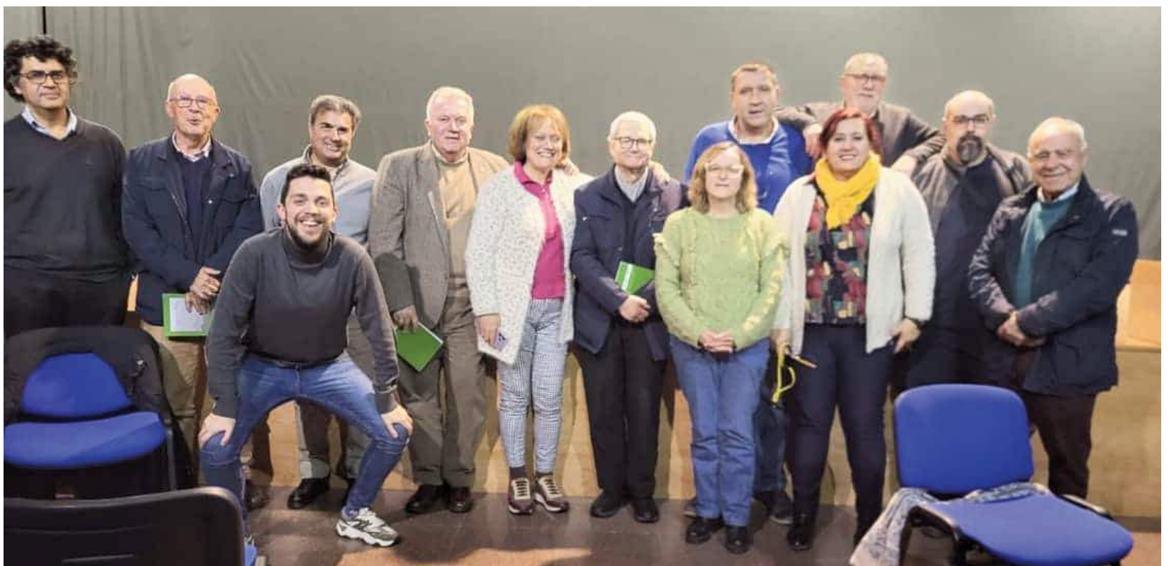
Foto de familia de los cronistas oficiales e investigadores locales de la Sierra Sur de Jaén que, entre otros temas, tratarán sobre la música en la comarca.