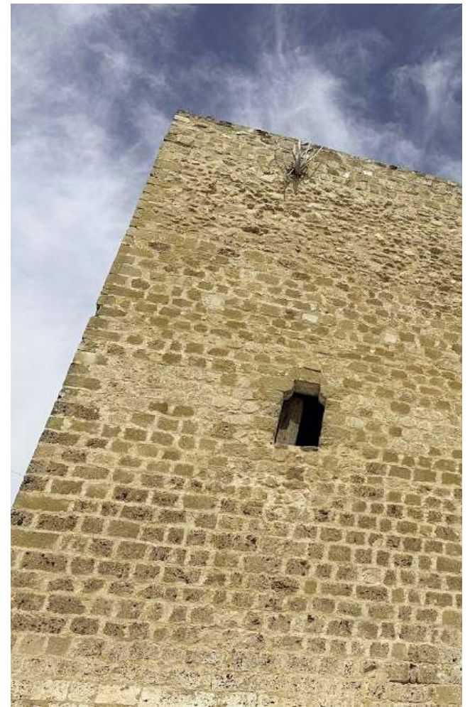
La Torre del Batán es un importante recurso turístico.

El alcalde recuerda además que otro de los grandes atractivos de Castillo de Locubín es la amabilidad de sus gentes, que convierten a la localidad en una cita obligada durante la Fiesta de la Cereza, que este año se adelanta una semana para ajustarse a las fechas de maduración del fruto y que se celebrará los días 7,8 y 9 de junio..