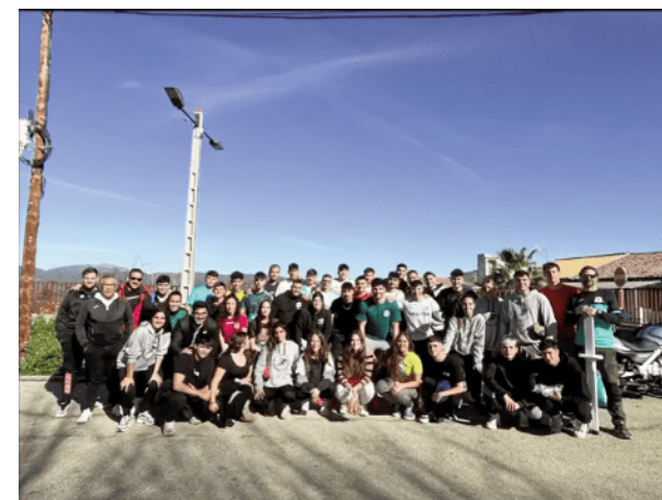
Foto de familia con los participantes del IES Pablo Rueda.

Para culminar esta experiencia inolvidable, al llegar al Nacimiento del Río San Juan, fueron recibidos con una cálida bienvenida por parte del Ayuntamiento de Castillo de Locubín. Se les ofreció la tradicional manta castillera acompañada de café caliente para reconfortarse. Además, como gesto de agradecimiento por su participación, cada uno de los asistentes recibió un obsequio especial por parte del Ayuntamiento.