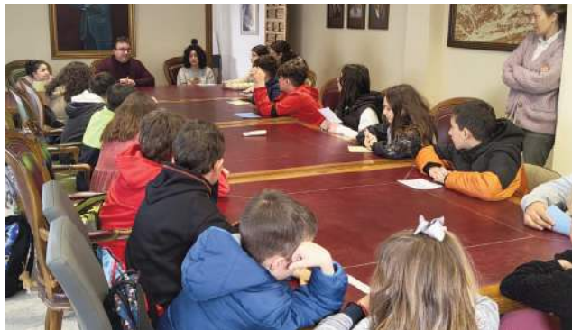
El alcalde explicó a los niños el funcionamiento del Pleno Municipal.

CDL El pasado 13 de marzo el Ayuntamiento acogió con entusiasmo una nueva edición del Pleno Infantil, esta vez con la participación del alumnado de 3º de la ESO del IES Pablo Rueda, de 6º de Primaria del CEIP Miguel Hernández y el alumnado del colegio Valle de San Juan de Ventas del Carrizal. Los jóvenes formaron diferentes grupos políticos con objeto de proponer mejoras para el municipio.