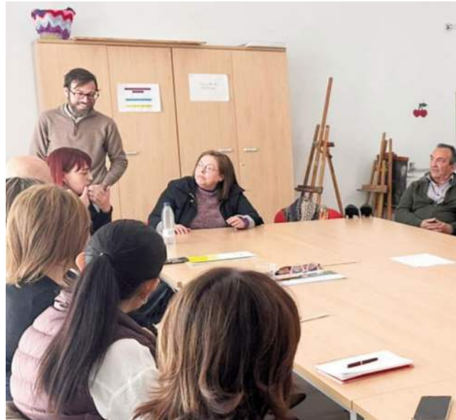
Castillo ofrece grandes atractivos para el teletrabajo.