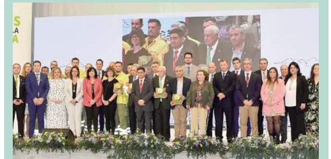
Edición de 2023 de la entrega de los Premios de la Provincia.