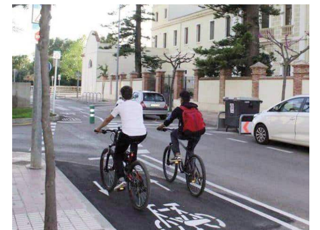
El proyecto trata de promover el uso de la bicicleta.

El carril bici, que ejecuta la Pavimentaciones Morales, conectará dos tramos ciclistas ya existentes: uno al Sur de la ciudad, dirección Los Villares, paralelo a la carretera A-6050 de Jaén a Castillo de Locubín, y otro situado en el Distribuidor Norte de Jaén, que se prolonga hasta la avenida de Aparejadores.