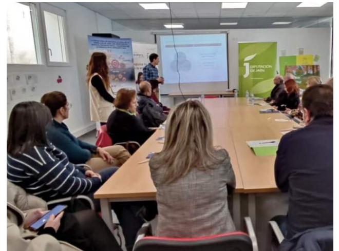
La jornada incluyó la celebración de una mesa redonda.

CASTILLO DE LOCUBÍN La Asociación para el Desarrollo Rural de la Sierra Sur de Jaén -AD-SUR- celebró el pasado 6 de marzo el relanzamiento de 'Acelera Pyme', la iniciativa de la Diputación Provincial que impulsa la transformación digital de las pequeñas y medianas empresas de la provincia facilitando su adaptación a las nuevas tecnologías y procesos de innovación.