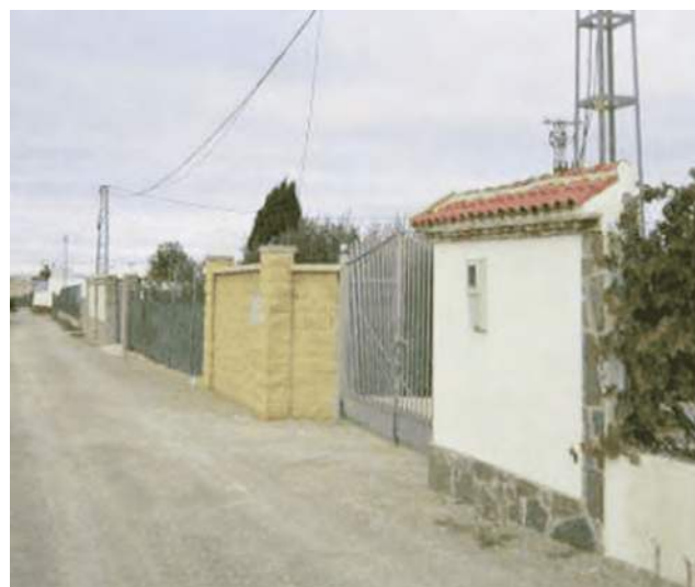
Fachada de una parcela en Torredonjimeno.

El primero, identificado como Zona A , se halla al sur de Torredonjimeno, cerca de la autovía A-316, entre la vía de enlace con la A-306, la Vía Verde y la antigua carretera de Martos. En el estudio se detalla que está compuesto por nueve parcelas, cada una de las cuales tiene al menos una edificación destinada a segunda vivienda y otras construcciones como piscinas, porches y barbacoas. "Se encuentra limitada físicamente por las infraestructuras anteriormente comentadas, lo que dificulta su desarrollo cre-