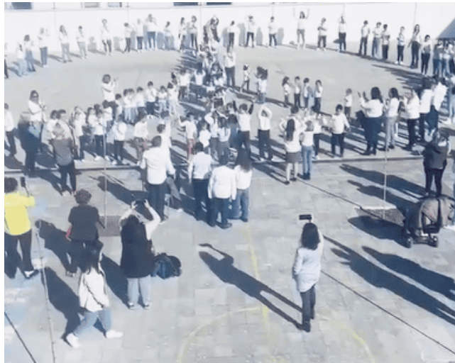
Alumado del centro durante las actividades realizadas.