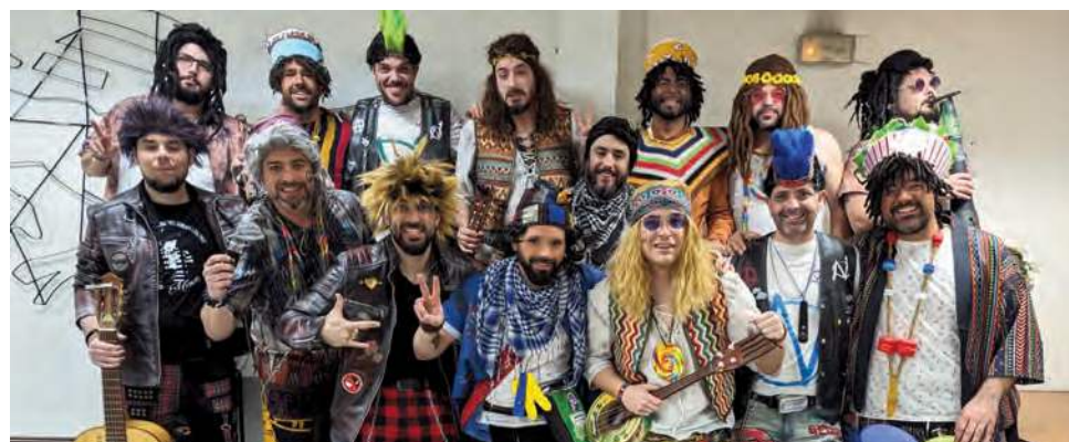
'Los Mimos' durante el Carnaval 2024.