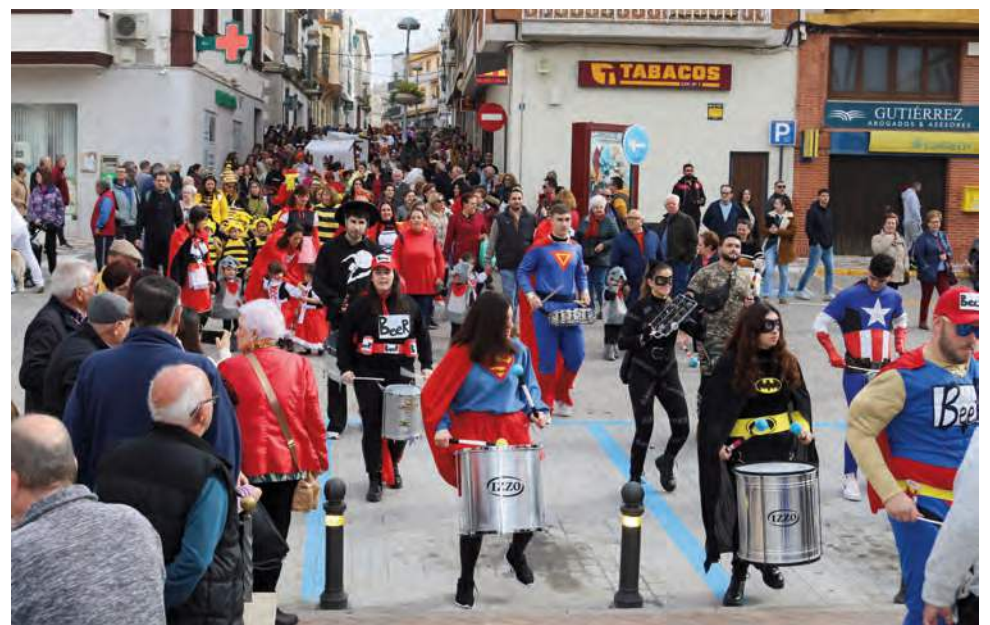
Ambiente en el pasacalles infantil de Carnaval 2024 con los centros educativos de la localidad.

El segundo fin de semana de Carnaval, del 8 al 11 de febrero, tuvo lugar los pasaca-