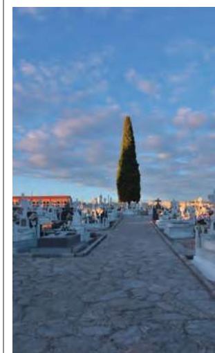
Cementerio de Torredonjimeno.