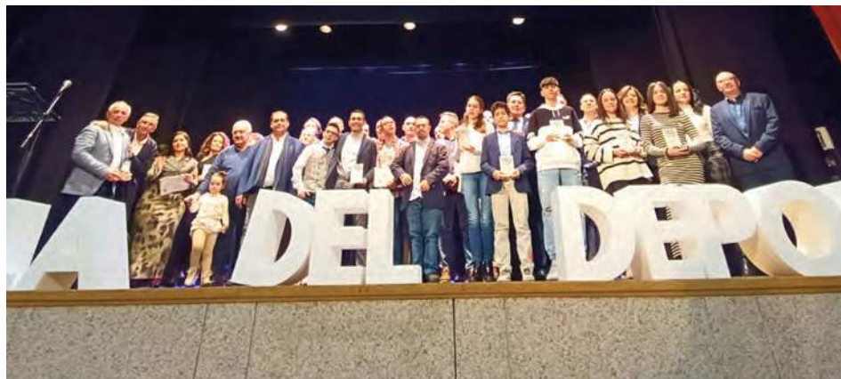
Premiados en la VII Gala del Deporte.

UNA NOCHE PARA PONER EN VALOR EL TALENTO LOCAL