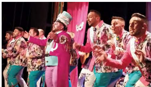
La chirigota de 'Los feos también cantan' en la final del COA 2024.