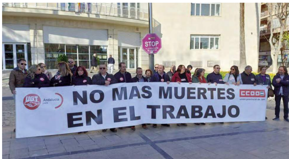
Concentración en la Sudelegación del Gobierno de la capital jiennense.

El accidente, que costó la vida a un trabajador de 31 años, se registró el lunes 29 de enero cuando la víctima se precipitó desde unos nueve metros de altura en el momento en el que realizaba ta-