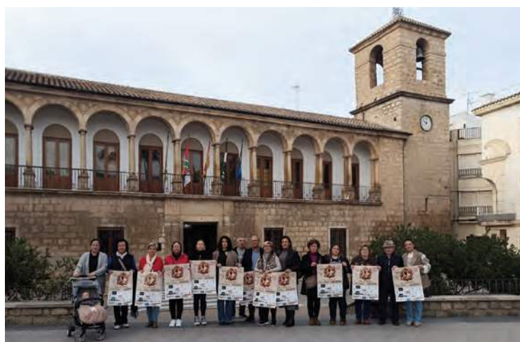
Presentación de la pasarela de moda.