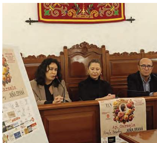
Presentación de la pasarela de moda.

Esta es una iniciativa que cuenta con la colaboración del Ayuntamiento.