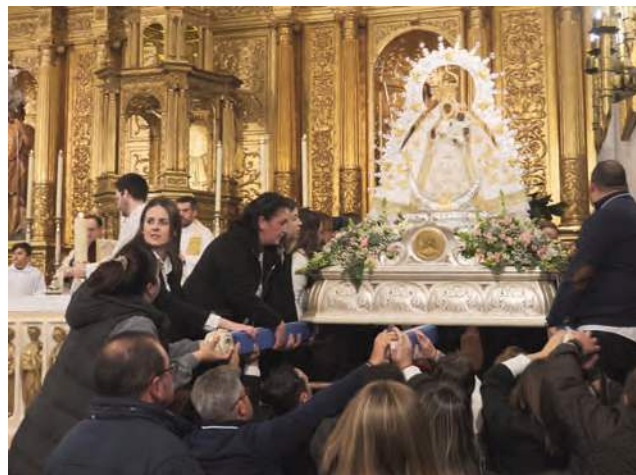
La Virgen de la Cabeza a su llegada a la Iglesia de Santa María.