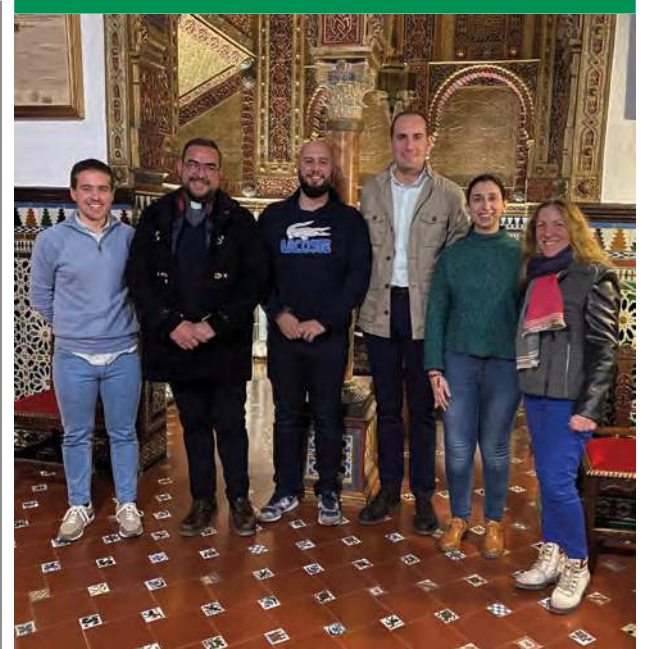
Recepción del nuevo presidente en el Ayuntamiento de Arjona.