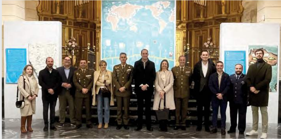
Representantes del Ayuntamiento y de la Delegación de defensa en Jaén en la inauguración.

ARJONA | La expedición de Magallanes y Elcano fue la primera en "recorrer y descubrir toda la redondez del mundo" según palabras del propio Juan Sebastián Elcano. Esto ocurrió entre 1519 y 1522, cuando los medios de navegación eran todavía increíblemente rudimentarios, y la vida a bordo de aquellas primitivas naves carecía de cualquier comodidad o