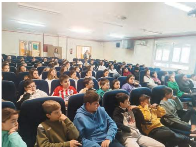
Alumnado de 5º y 6º de primaria del CEIP San Bonoso y San Maximiano.