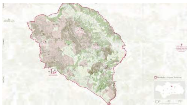
Representación de Arjona en Fitur.

Una de esas 14 zonas es Campiñas de Jaén, donde mejor se puede percibir y sentir este paisaje. Se ha delimitado una zona, de forma cuadrangular, a modo de pixel característico de una trama, com-