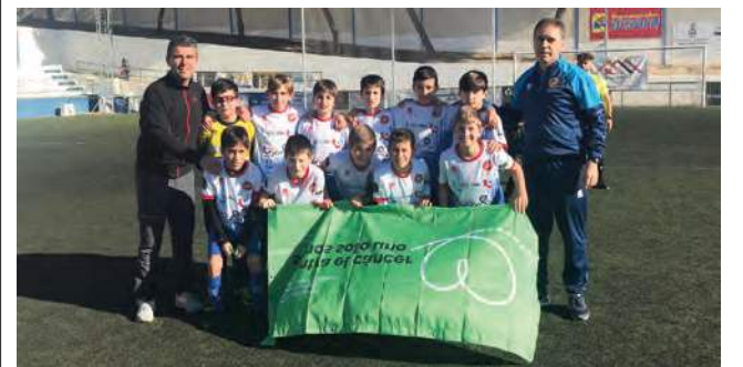
Canteranos del Uragavona participando en la campaña.

ARJONA | El pasado fin de semana, los jugadores de todas las categorías del Uragavona C.F. lucían un brazalete verde en los encuentros deportivos que disputaron para concienciar a la sociedad de la necesidad de seguir invirtiendo tiempo y dinero en la lucha contra el cáncer, con motivo