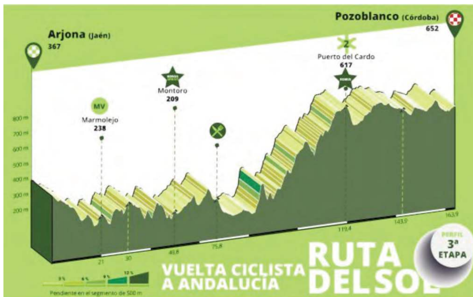
Perfil de la tercera etapa de la Vuelta Ciclista a Andalucía con salida en Arjona. ORGANIZACIÓN

concretamente en Cádiar. A falta de conocer todos los detalles íntegros, Vélez Málaga, Arjona y Benahavís han sido elegidas para albergar salidas