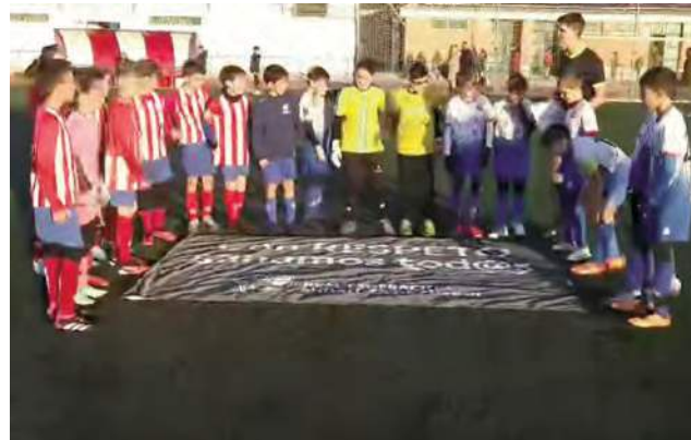
Momento del partido entre el Urfavona C.F. y la U.D.C. Torredonjimeno

El Ayuntamiento de Arjona ha hecho un reconocimiento a esta acción afirmando que “un campo de fútbol no es un cubo de basura en el que dejar nuestras frustraciones, provocaciones, insultos y hasta agresiones. Un campo de fútbol es un lugar en el que disfrutar del deporte, forjar nuevas amistades y aprender a respetar a los demás y a uno mismo. A veces, quienes nos educan son nuestros niños, niñas y jóvenes. Sólo hay que