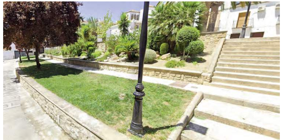
Calle M a Luisa de Arjona. AYUNTAMIENTO DE ARJONA

El PFEA es un programa de empleo financiado por el Estado que subvenciona los costes salariales y las cotizaciones empresariales de