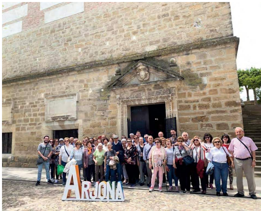
Grupo de turistas en una de las visitas guiadas a Arjona.

El servicio turístico más demandado es la visita guiada al conjunto monumental, seguida de la ruta literaria Juan Eslava Galán y la visita a monumentos y museos. La diversifi-