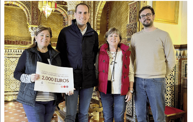
Pie de foto.

SOLIDARIDAD Proyectos del Grupo Solidario