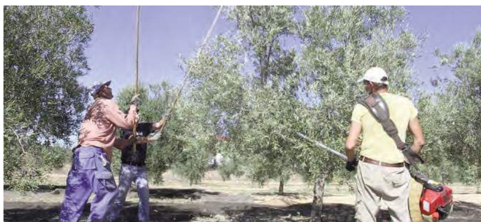
Trabajos en la recogida de aceituna.

De las incidencias que se vienen produciendo en esta campaña, cabe destacar que este año no se está quedando fruto en el árbol, todos los olivos, hayan producido más o menos aceituna, están siendo recolectados debido al elevado precio del aceite, al contra-