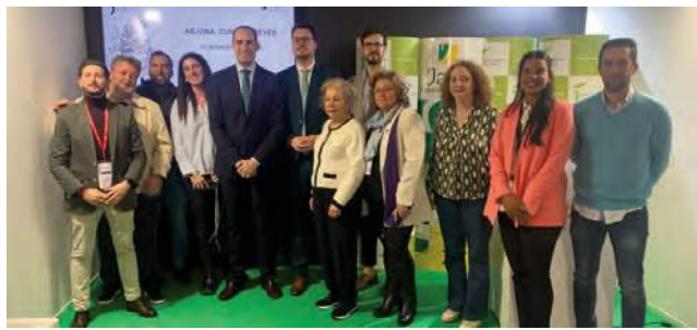
Representación de Arjona en Fitur. AYUNTAMIENTO DE ARJONA

PRODUCTOS Los nuevos paquetes presentados se suman a la oferta amplia turística de Arjona como la Ruta Literaria Juan Eslava Galán o 'Un viaje de Al-Andalus al Barroco' en colaboración con Baños de la Encina