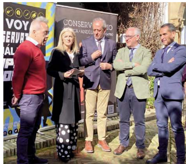
Patricia del Pozo visitando Andújar.

Estas actuaciones, aseguró Del Pozo, vienen a avalar una vez más el compromiso del Gobierno andaluz por proteger y potenciar los estudios de música, que no siendo obligatorias son fundamentales para el desarrollo integral de nuestra sociedad y también para el impulso del tejido productivo de Andalucía. Además amplía la oferta de los estudios de Música en la provincia de Jaén, que contará con una red de conservatorios integradas por 6 elementales, 4 profesionales y un superior. Este curso están matriculados en los estudios de música un total de 3.187 alumnos.