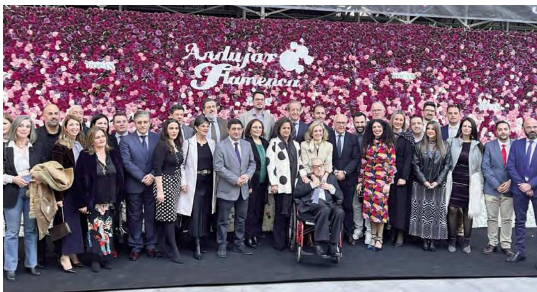
Representantes de instituciones en la presentación de Andújar Flamenca 2024. ANDÚJAR FLAMENCA