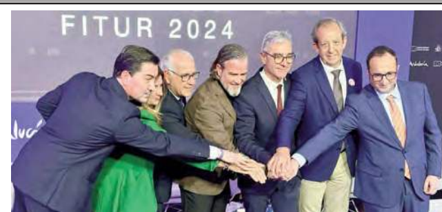
Representación de Arjona en Fitur.