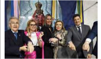
Presentación de la pulsera. M.C.L