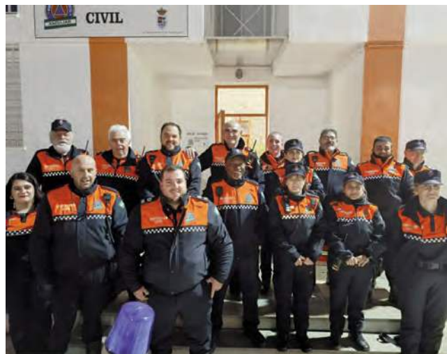
Miembros de Protección Civil Andújar.