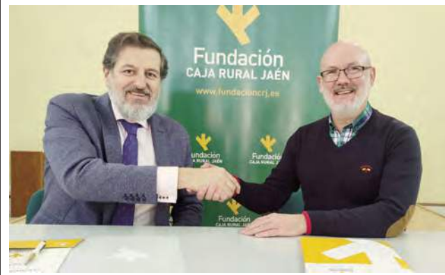
Firma acuerdo de colaboración.