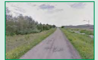
Fachada Ayuntamiento de Lopera.