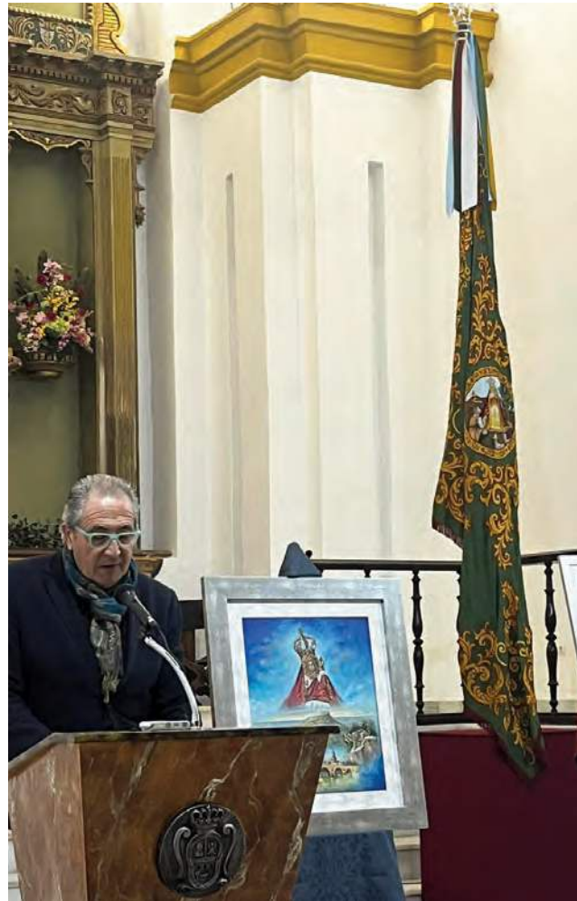
Aldehuela en la presentación del cartel anunciador. COFRADÍA MATRIZ.

El consistorio andujareño obviaba un acto ya tradicional en esta feria, como era la presentación del cartel de la Romería, al que asistían numerosos vecinos de Andújar y miembros de la Cofradía Matriz de la Virgen de la Cabeza que, en colaboración con la Cofradía Filial de Madrid, promocionaban el atractivo turístico más multitudinario en la ciudad.