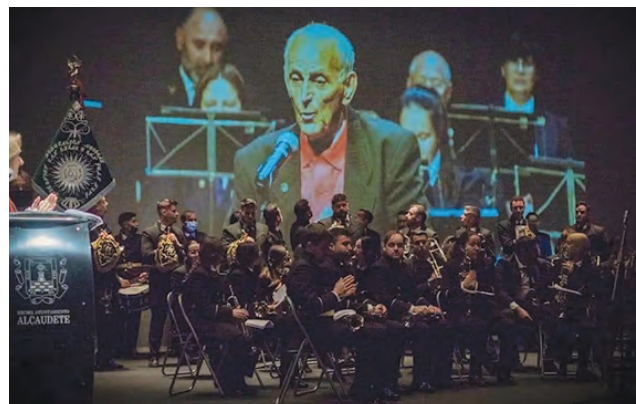
La Banda de San Elías participó en el encuentro.