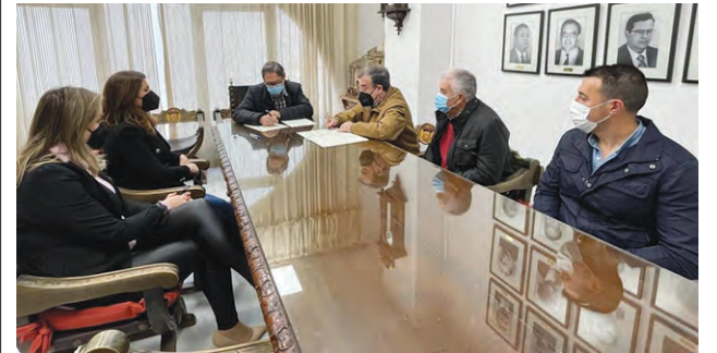
Momento de la firma de la renovación del convenio.

ALCAUDETE | El Ayuntamiento de Alcaudete ha renovado el convenio de colaboración con la Asociación Musical Miguel Ángel Castillo Ojeda. Un convenio que supone la continuidad de los Cursos Musicales de Verano, que comprenderá los ejercicios de 2022 a 2025 y donde la administración local se compromete a aportar por toda la vigencia del Convenio la cantidad de 48.000 euros.