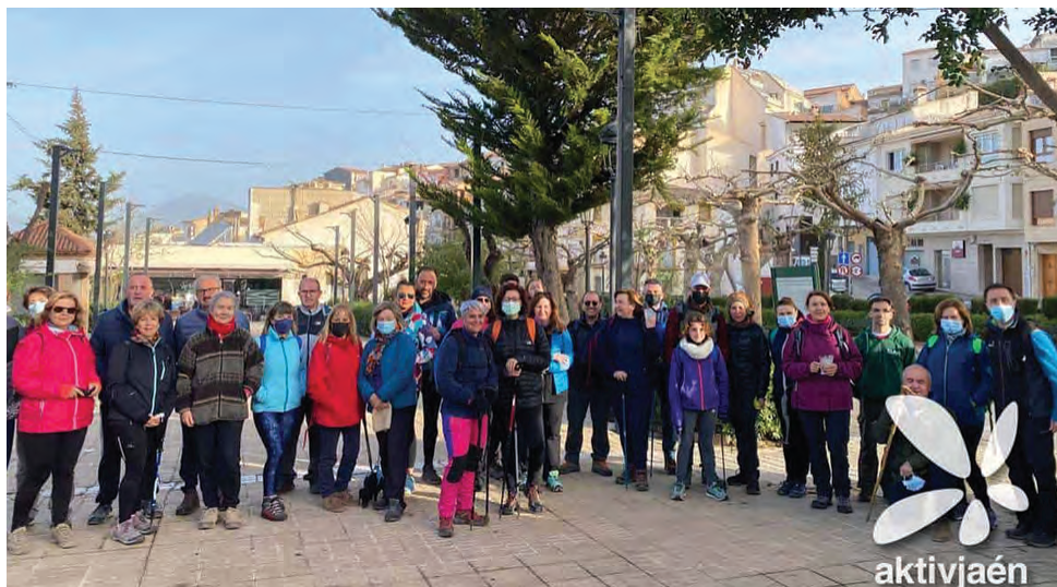
Un total de 37 senderistas participaron de la actividad en Castillo de Locubín.

coloca en cabeza de la tabla del campeonato que tendrá continuidad el 19 de junio en el circuito de Campillos (Málaga), el 2 de octubre en Villafranca y que finalizará de nuevo en el circuito de Campillos el próximo 27 de noviembre.