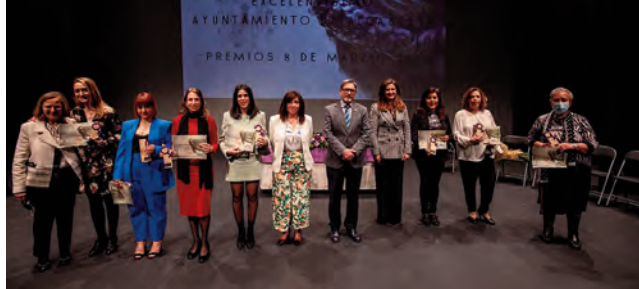
Las galardonadas posan junto a sus reconocimientos

REDACCIÓN | Cinco menciones especiales y un «Premio 8 de Marzo» fueron los reconocimientos que se otorgaron en la conmemoración del Día de la Mujer. La entrega de estos Premios realizan un homenaje a mujeres destacadas por trayectorias comprometidas con la igualdad. Estas premiadas se proponen al Consejo Local de la Mujer a través de las asociaciones de mujeres o entidades del municipio, incluidas las de El Sabariego, Los Noguerones y La Bobadilla.