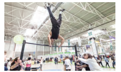
Imágenes de las distintas actividades que tuvieron lugar durante la celebración de la Feria de los Pueblos.