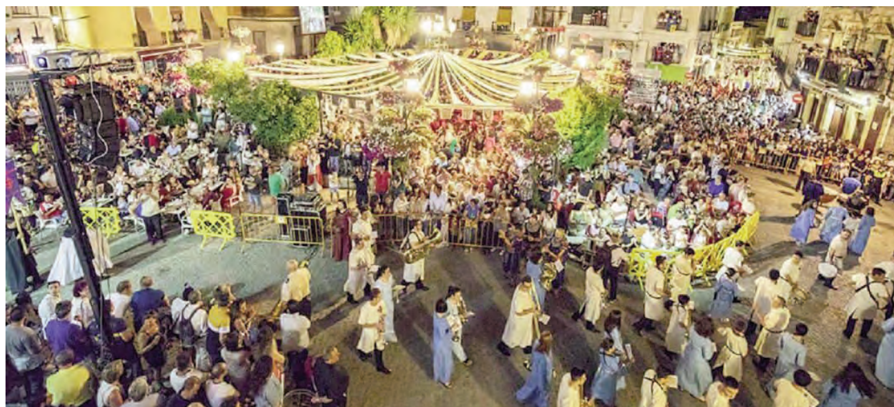
La convocatoria de los concursos supone el pistoletazo de salida a la celebración de las Fiestas Calatravas de Alcaudete.

Podrán participar en ambos concursos autores nacionales y extranjeros con un máximo de dos obras por autor; con premios de 700 y 500 euros. El plazo para la presentación de los trabajos finalizará el día 9 de mayo de 2022. Se establece, en la edición presente de 2022 un primer premio dotado con 700 euros al cartel ganador. Dadas las circunstancias de emergencia sanitaria actuales, que imposibilitan la votación popular mediante voto presencial, en esta edición el jurado técnico y dirimente determinará el 100% del total de puntuación.