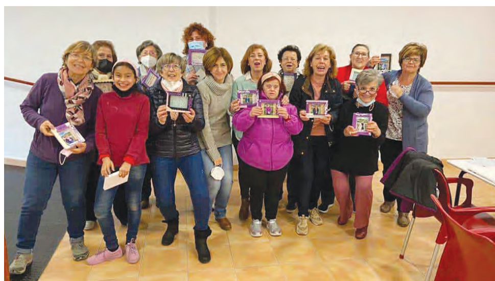
Participantes en el taller de “Scrapbooking” celebrado en Ventas del Carrizal.

los hijos de andaluces en Cataluña. ‘Olivos de cal’ es la novela ganadora del Premio Nacional de Narrativa Ateneo Mercantil de Valencia 2019. La crítica habla de ella como una novela rural digna heredera del Delibes más sobrio, con dos historias que se encuentran en los años 30.