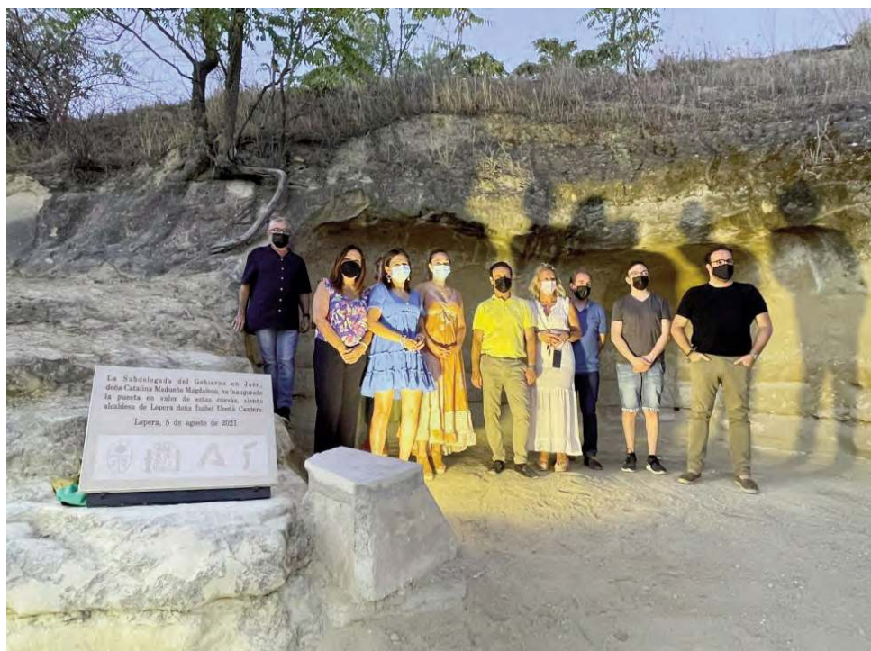
Foto de familia junto a las nuevas casas cueva recuperada en el municipio.

LOPERA | La subdelegada del Gobierno de España en Jaén, Catalina Madueño, ha puesto en valor que las obras que se realizan en la provincia gracias al Plan de Empleo Agrario (PFEA) permiten dotar a los municipios de infraestructuras y servicios de calidad. Así lo ha destacado durante el acto de inauguración de la remodelación del entorno de las antiguas casas cuevas de Lopera, en el que la subdelegada ha participado junto a la alcaldesa de la localidad, Isabel Uceda. Este proyecto, que se encuadra en la planificación del año 2020, ha contado con un presupuesto de 259.132 euros, de los que el Gobierno de España ha aportado 178.712 euros, correspondientes al pago de la mano de obra y Seguridad Social, que está subvencionado por el Servicio Estatal Público de Empleo (SEPE).