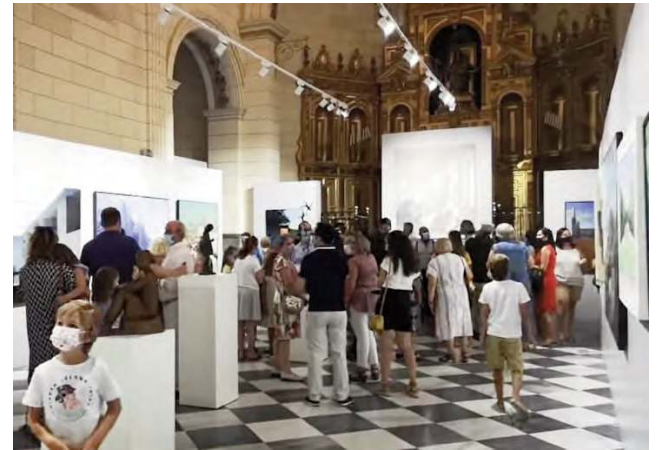
Los arjoneros disfrutaron de esta muestra el día de su estreno.