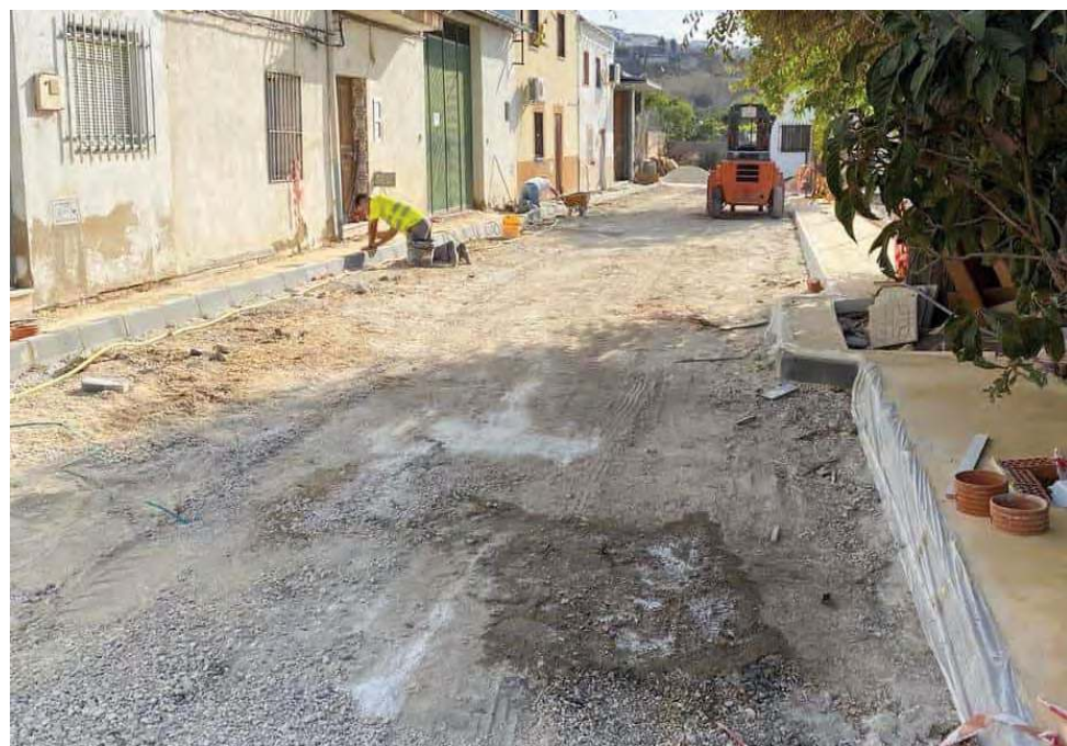
Obras de la calle Arrabal de San Martín.

Por otra parte, también se han llevado a cabo un arreglo integral de la calle Arrabal de San Martín con una inversión de unos 60.000 euros con los que se ha implantado un nuevo acerado, modernizado la red de aguas, instalado un nuevo alcantarillado y un nuevo asfaltado. Con esta actuación ha mejorado el entorno de esta zona con la intervención en la calle Tercia, la construcción de la rotonda de la calle Arrabal de San Juan, el cambio de iluminación en todo el barrio y con la instalación de una gran barandilla en la calle Corrales Javalera.