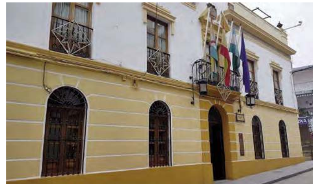
Fachada del Ayuntamiento de Arjona

En cualquier caso, según este estudio, en todas las localidades jiennenses se produjo una evolución positiva en los ingresos de los hogares. La incógnita ahora está en ver si, desde 2018 se ha mantenido la tendencia positiva o si, por el contrario, los hogares comenzaron a empobrecerse.