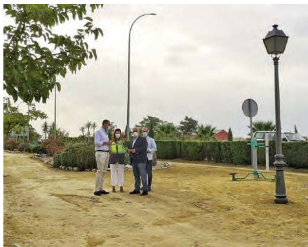
El alcalde de Arjona y el delegado de Fomento en una visita a Arjona.

cado la contribución de esta acción de la Consejería a una mayor eficiencia energética, con beneficios para el medioambiente y un ahorro de hasta el 68% en la factura de la luz para las arcas municipales. Las luminarias se sustituirán en su totalidad por otras del tipo LED para aportar mayor nivel de iluminación y mejorar la seguridad.