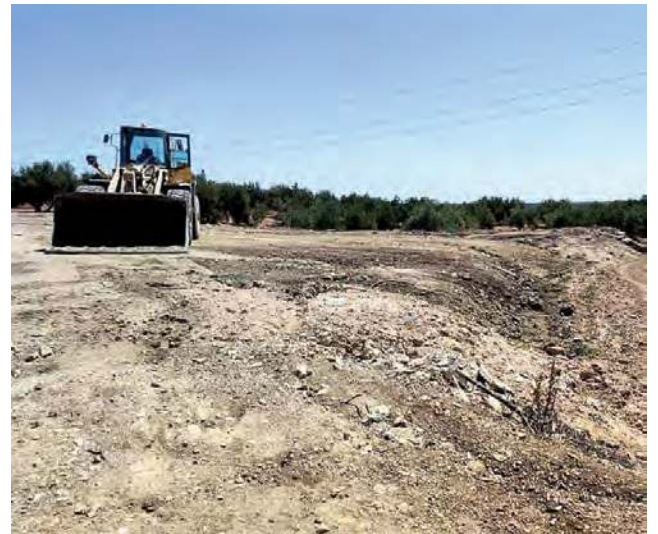
Una de las excavadoras durante las labores de limpieza realizadas.

Se recuerda que todos estos servicios son gratuitos para los vecinos de Lopera, aunque el Ayuntamiento sí que tiene que pagar para que se lleven a cabo en el municipio.