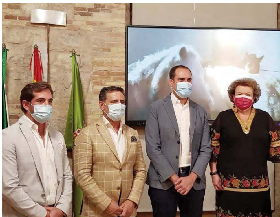
Presentación del I Salón Anual del Caballo Ciudad de Arjona.

Una cita pionera en el municipio que abarcará del 17 al 19 de septiembre, en coincidencia con la tradicional Feria