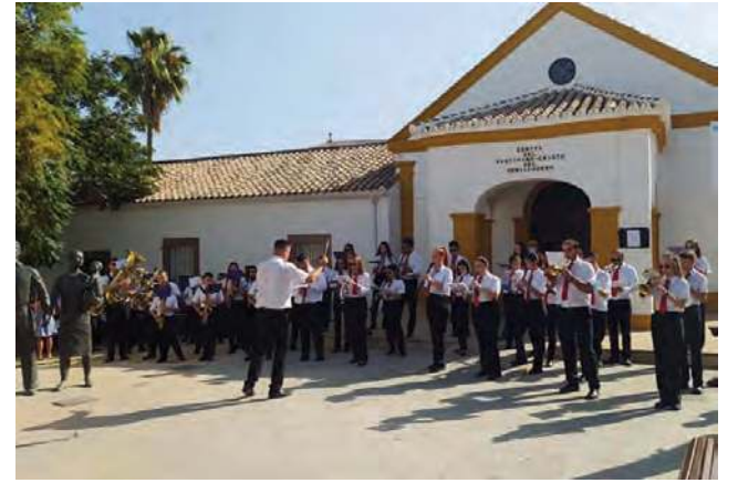
La banda de música local da inicio a las fiestas municipales.

El Ayuntamiento promovió actividades culturales y musicales en el Jardín Municipal y Campo de Fútbol, cumpliendo la normativa sanitaria y con el público sentado.