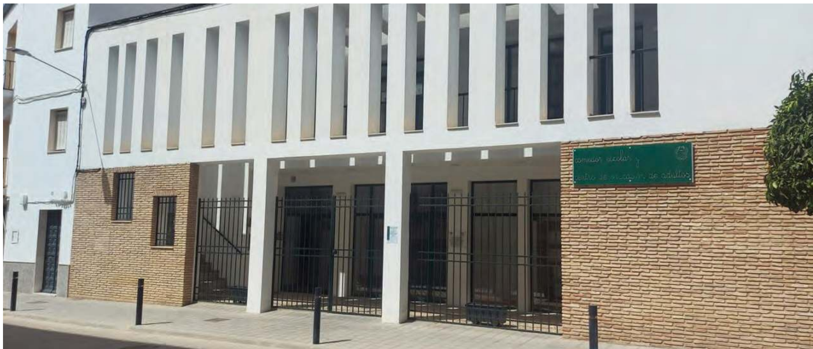
Entrada principal del edificio en el que se desarrolla el servicio de comedor escolar en el municipio de Lopera.

CONCILIACIÓN Según denuncia la alcaldesa del municipio, Isabel Uceda: “Hace dos años la oferta era de 45 plazas y ahora quieren recortar hasta las 15 matrículas, es decir, 30 menos”