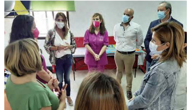
El CAIT inició su actividad en Arjona el pasado 1 de junio.