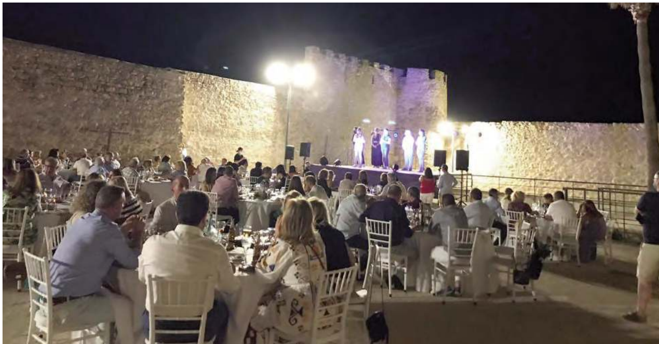
Los comensales disfrutan del evento en un marco incomparables como es el castillo calatravo del municipio jiennense de Lopera.

Esta IV Noche Gastronómica de Lopera fue organizada conjuntamente por el consistorio loperano, la Diputación y la Asociación Jaén Gastronómica, y en esta propuesta confluyen, según el presidente de la Administración provincial, “un enclave único y mágico como es este castillo calatravo, inmejorables pro-