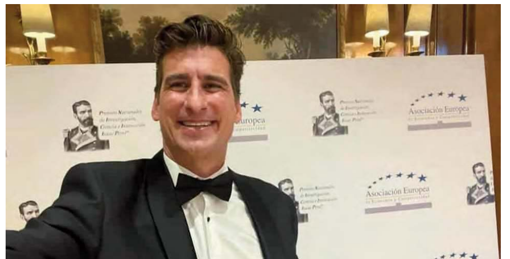
Enrique Criado en la gala donde fue reconocido con el Premio Nacional de Investigación, Ciencia e Innovación.

en este campo de la medicina a lo largo de su trayectoria profesional. Además, ha trabajado en varias de las mejores clínicas de Italia y Estados Unidos, y se ha formado en las últimas técnicas de laboratorio y realizado diversas investigaciones para mejorar los protocolos de congelación de células.