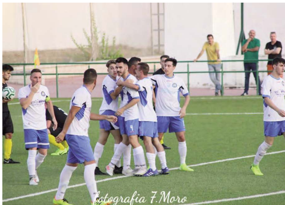
Los jugadores celebran un gol durante uno de los partidos disputados durante esta temporada en casa.