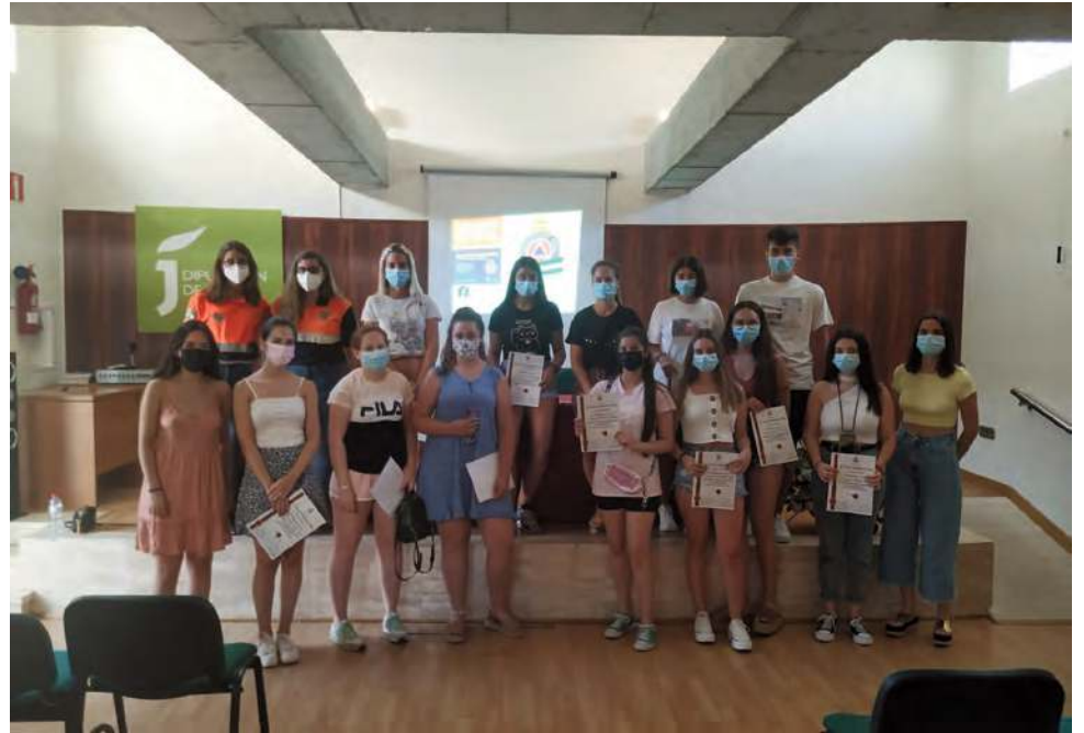
Quince jóvenes arjoneras reciben un curso de primeros auxilios enmarcado en 'Un verano a tu medida'.

Por el momento ya se han realizado algunas de las actividades previstas, como son el curso de primeros auxilios, donde han participado 15 jóvenes, y el concierto de clausura de la banda de música 'Bonoso Baena'.