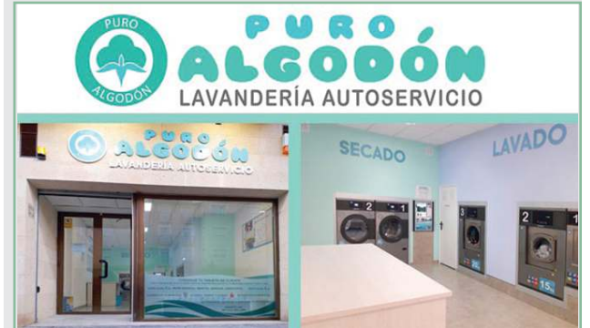
Un sistema sencillo, ecológico, higiénico, económico y rápido.

REDACCIÓN | Hace pocas semanas abrió en la Plaza de la Almazara la lavandería "Puro Algodón", que ofrece un moderno sistema de autoservicio sencillo, higiénico, económico, ecológico y rápido.