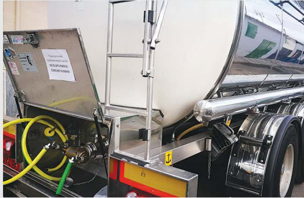
Un camión cisterna permaneció en la localidad.