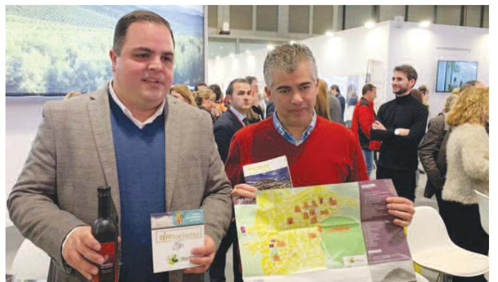
El alcalde y el concejal de Turismo dieron a conocer los atractivos que ofrece Martos a los visitantes.

Como novedad, este año se presentó en Fitur el programa