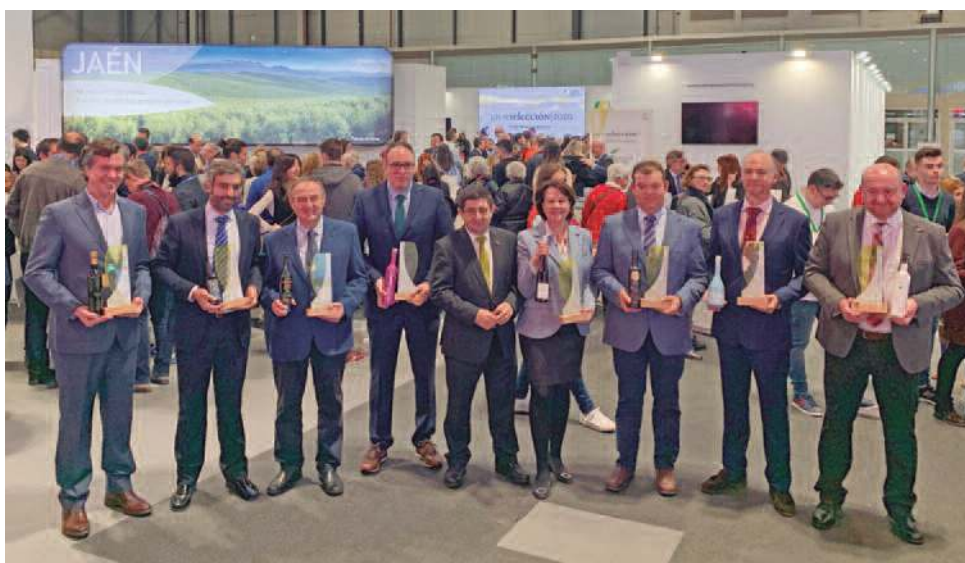
La feria fue de nuevo escenario de la entrega de los premios Jaén selección a los mejores AOVES de 2020.

Durante cinco días, la provincia de Jaén protagonizaba una activa presencia en una feria en la que ha participado a través del stand que la Diputación de Jaén tenía dentro del pabellón de Andalucía, en el que se “ha desarrollado una intensa programación”, como apuntó Lozano, “tanto por los destinos turísticos que trabaja la Diputación como por los recursos propios que hemos difundido, desde rutas como la de Castillos y Batallas o el Viaje al tiempo de los Iberos, hasta la gastronomía jiennense o el oleoturismo, y especialmente el destino de aventura que representa nuestra provincia, que