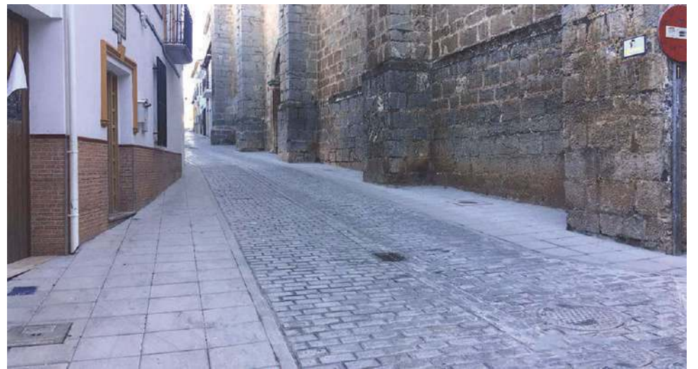
En la mejora de la calle se optó por el empleo de adoquines. AYUNTAMIENTO

han eliminado parches y rampas irregulares, lo que dota de un aspecto más acorde con el resto de calles del casco histórico. Por esta razón, se optó al igual que en otras calles, por el uso de adoquines. En los próximos días comenzará una segunda fase, hasta alcanzar sucesivamente los casi 500 metros que tiene esta calle. El presupuesto total ascenderá a los 498.000 euros.