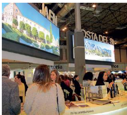
Imagen del stand de la provincia.

Con este viento de cara, la expedición jiennense en FITUR, capitaneada por la