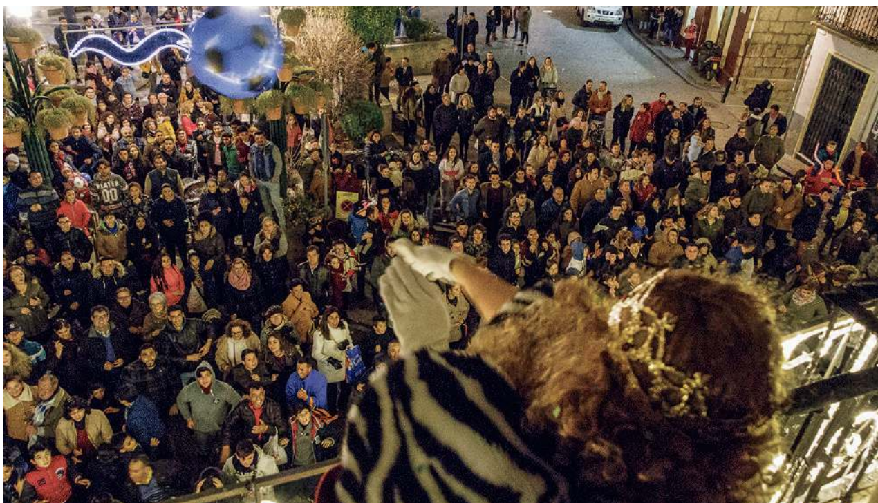
Desde el balcón del Ayuntamiento Sus Majestades repartieron regalos a los niños y niñas que esperaban audiencia real.

En la cabalgata de Los Nogeros participaron tres carrozas en cuya preparación participaron la Comisión de Festejos bajo la dirección de Cristina Ávila, la banda de música y el Ayuntamiento de Alcaudete. Al finalizar la Cabalgata, los Reyes hicieron el tradicional reparto de regalos en el