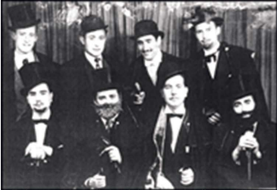
Significativas personas de la sociedad local recorrían las calles, en una simulación grotesca de la realidad.

Sus corros, ruedas, coplas, entierros de la sardina, juegos (especialmente el de pasarse botijos, o cántaros, dentro de una rueda, o a la gallinita ciega para romper algunas de esas vasijas) constituía un paréntesis relajante y permisivo que facilitaba los encuentros entre los jóvenes enamorados y propiciaba la búsqueda de pareja. Era una fiesta con marcado carácter femenino.