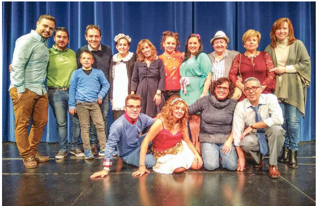
El grupo de teatro lo componen quince aficionados del municipio de todas las edades.