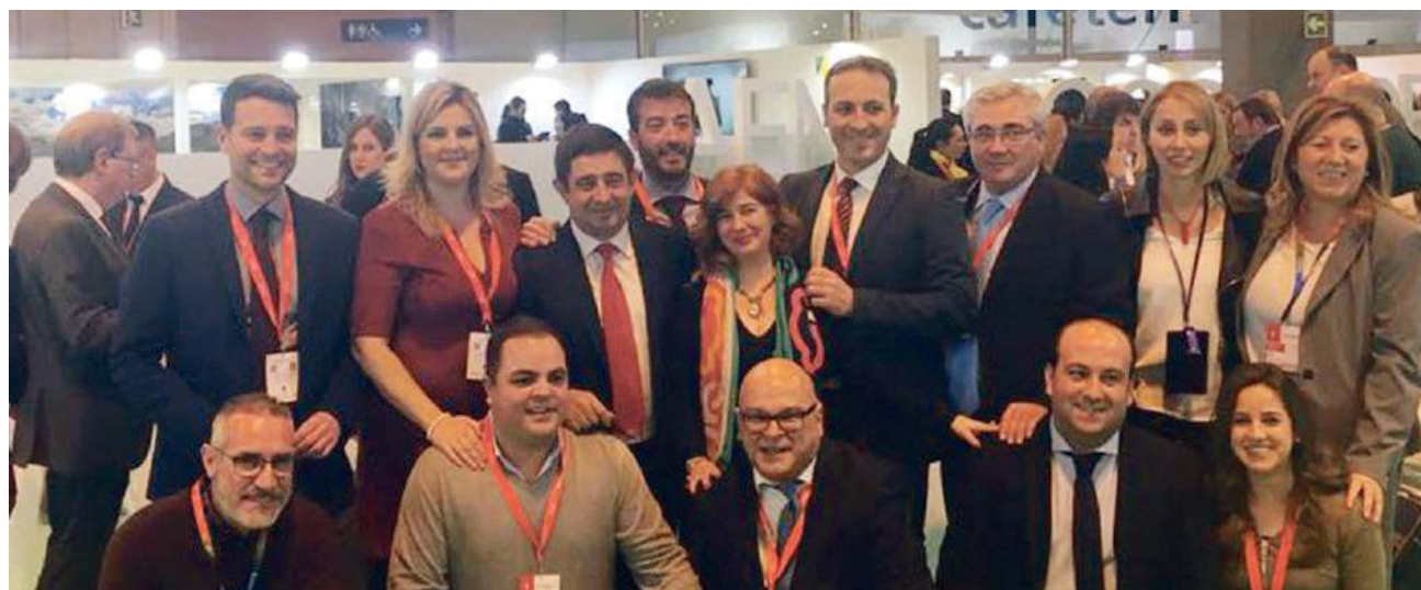
Imagen de una cuadrilla de jornaleros en la pasada campaña.

PRESENCIA DESTACADA Jaén se promociona en Fitur 2018 con Úbeda y Baeza, el oleoturismo y el turismo activo como principales protagonistas REPUNTE Los datos apuntan a un crecimiento del número de turistas de un 4 por ciento en la provincia.