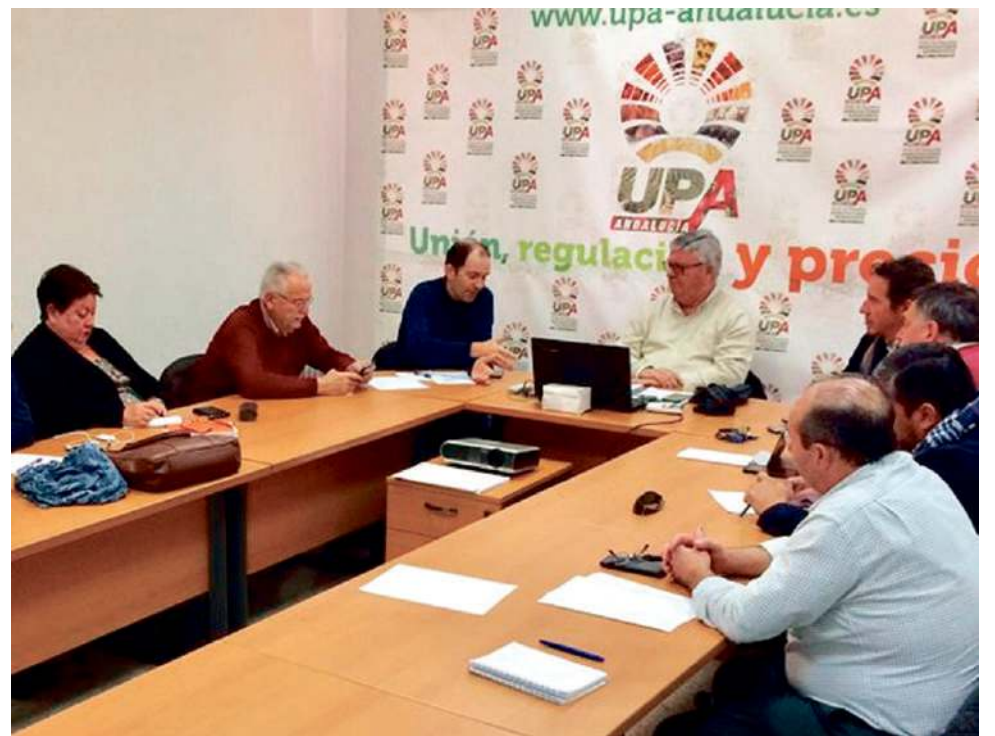
Rueda de prensa de los responsables de la organización agraria y ganadera.

Asimismo, un año más persiste, según el colectivo, el problema trascendental de