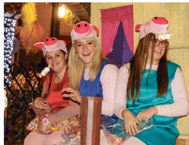
Luz y color en la noche más mágica del año.

En Alcaudete participaron once carrozas y más de doscientas personas que repartieron 2.000 juguetes y más de 1.500 kilos de caramelos