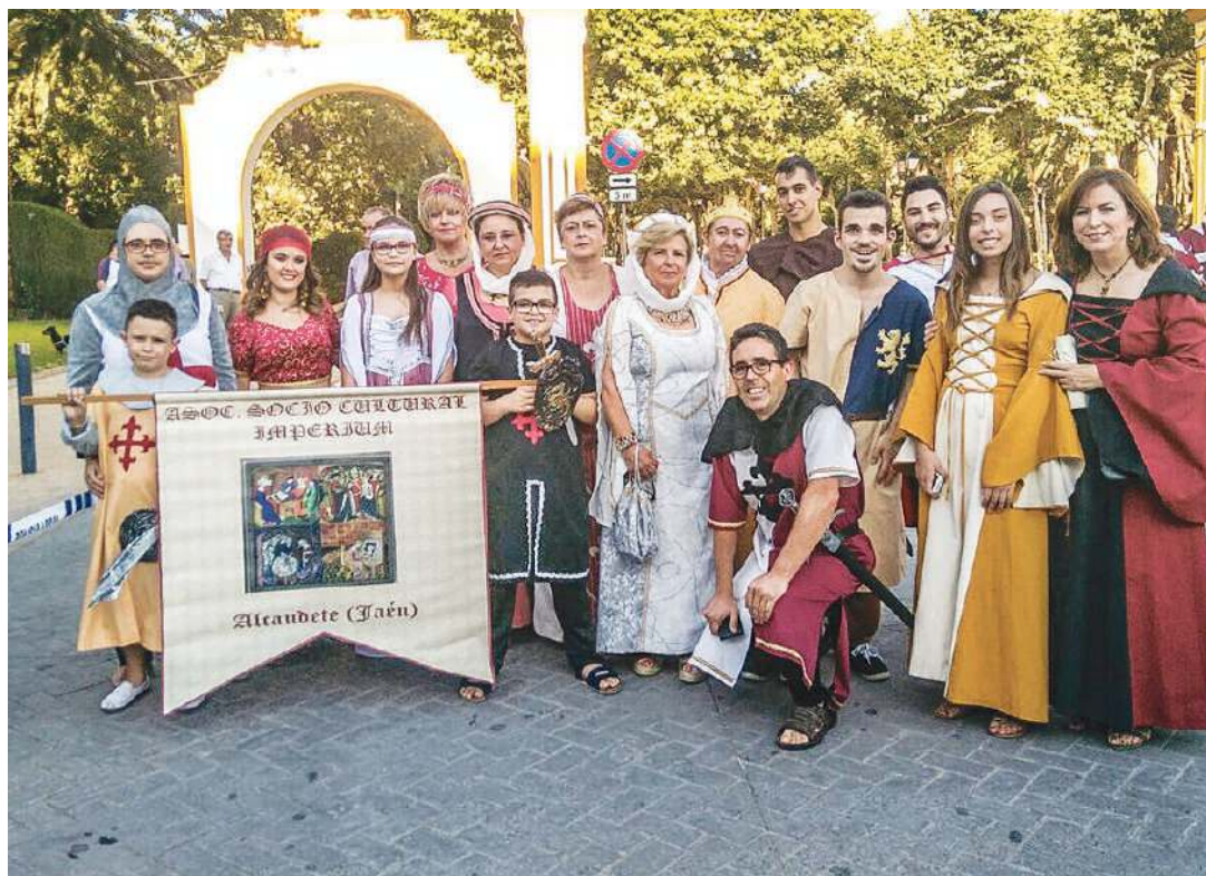
La asociación "Imperium" llevó "La Venganza de don Mendo" a las calles durante las Fiestas Calatravas.