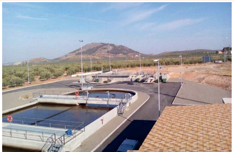
La gestión de la EDAR de Alcaudete se incluye en la concesión administrativa. VIVA

El contrato también incluye la gestión de la Estación Depuradora de Aguas Residuales (EDAR) de Alcaudete, que entre octubre de 2015 y noviembre de 2016 procesó 1 millón de metros cúbicos. Según informó el alcalde, Valeriano Martín “con esta adjudicación se pretende mejorar la gestión y la calidad del agua para los cerca de 7.000 vecinos abonados al servicio en Alcaudete y sus pedanías que requieren más de medio millón de metros cúbicos de agua al año”.