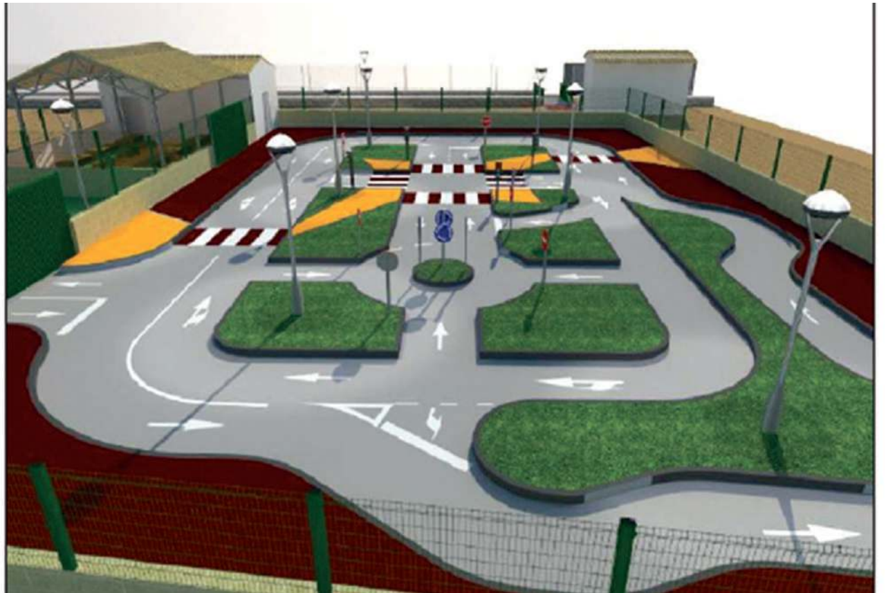
El proyecto del Parque de Educación Vial estará finalizado a los seis meses del comienzo de la obra. VIVA

Según el alcalde, Valeriano Martín, “estas mesas de contratación suponen la culminación de un proceso de muchísimo trabajo sobre unos proyectos que verán pronto la luz y serán una realidad constatable, como el final de obra en la plaza de los Postiguillos y la calle Campiña”.